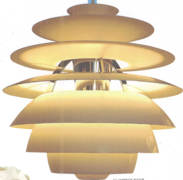
IQ Light的EMOOK

IQ Light近年以自己动手拼做的浑圆灯具受到欢迎,由使用者发挥创意,自己将一片片的灯罩组合起来,要长要圆任君选择。丹麦有不少新兴设计师善用木片和塑胶片的柔软,扭转出独特的形状,一如Le Klint的经典百褶灯罩,从山谷折线延伸为曲线,没有太多加工,转个弯,就让商品呈现另一种质感。