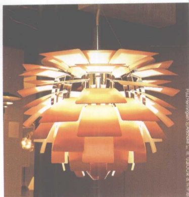
Paul Henningsen的雪球灯(Snow Ball)EMOOK 周治平摄