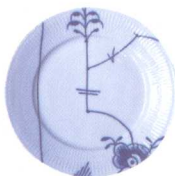
皇家哥本哈根瓷盘