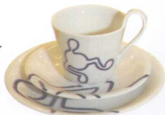
皇家哥本哈根music系列

北欧设计萌芽期始于第二次世界大战后，20世纪50~70年代，是北欧设计大师们大放异彩的年代，虽然曾经被欧洲其他艺术品和潮流影响而衰退，但今日，在全球掀起热流的北欧设计仍以一种当代的时尚、新世纪美学的姿态成为设计潮流的指标。