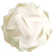
Paul Henningsen的雪球灯(Snow Ball)EMOOK 周治平摄