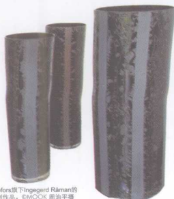
Orrefors旗下Ingegerd Rånman的系列作品。