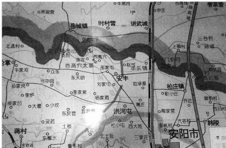
引起轩然大波的安阳市西高穴村所在位置

平静和沉寂，立刻成为新闻媒体深入挖掘、深度报道的超级热门话题。一时间，大街小巷众说纷纭，距今 1800 年的曹操再度形成为一个巨大的文化旋涡，将地方政府、学术界乃至社会大众一并裹挟了进去，成为考古学史上一个空前的人文景观，新闻学上也可名之为“曹操墓现象”。