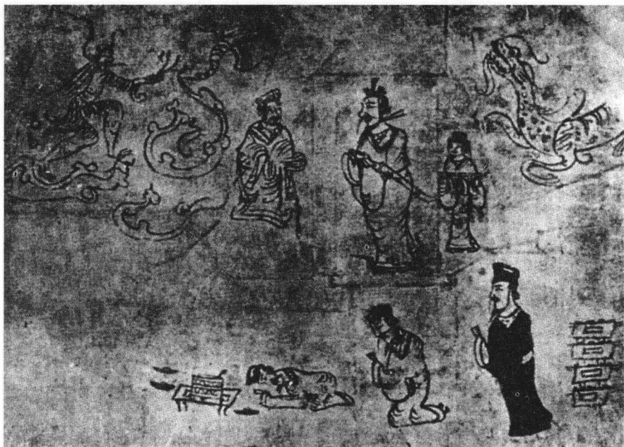
金县出土的东汉祭奠壁画