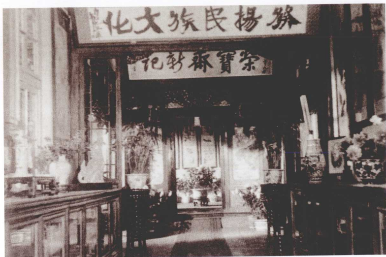
50年代北京荣宝斋营业厅内景

我的父亲是一个1925年加入共产党的老革命，虽参加革命，但由于出身地主家庭，受传统文化的影响，仍喜爱书、画。受他的影响，使我小的时候就喜欢书、画。尤其见到好画时，一种纯洁美好的感情会油然而生。70年代中期，有一次我和父亲闲聊，父亲说：“以后不要存钱，把钱都买成画放起来，人民币可能会像卢布一样贬值。”父亲的这句话让我把所有的钱都拿到荣宝斋买了画，使我从一个书画爱好者，走上了对书、画收藏研究的路。