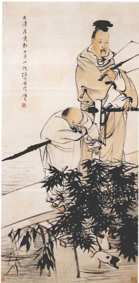
清·任伯年《羲之爱鹅图》