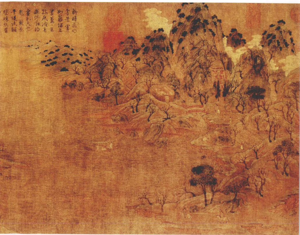
隋·展子虔《游春图》(局部)