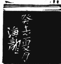
见忘居主水墨 (附边款)