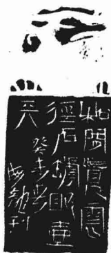
石罅晒壶天（附边款）