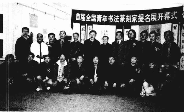
七十年代书法家作品展