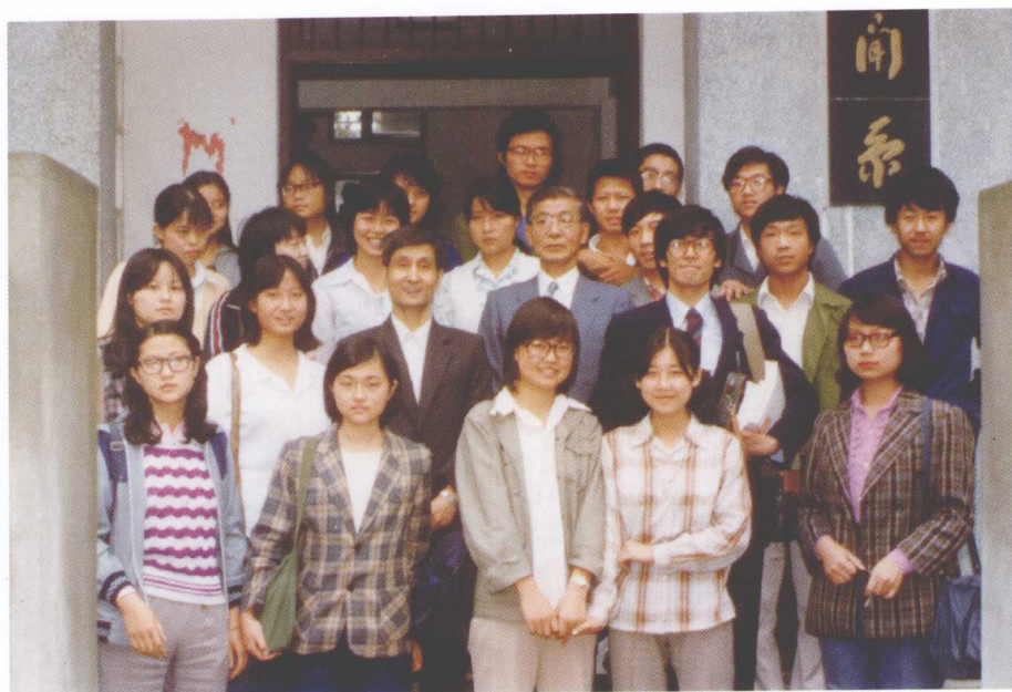
1987年6月，作者（二排左三）与前来访问的日本一桥大学教授一行及同学们在新闻系办公楼前合影