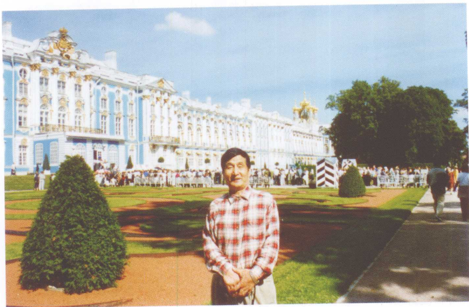
2000年8月3日，作者在俄罗斯圣彼得堡市普希金城参观访问时留影