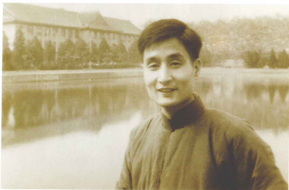
1964年12月，作者任四川大学校报编辑时在川大校园留影