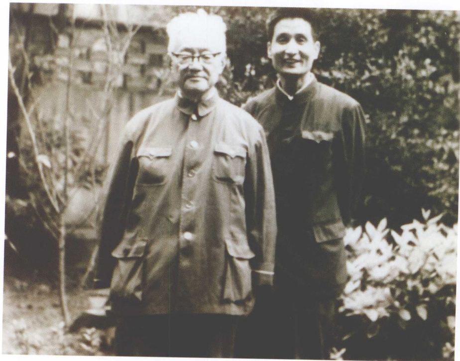
1980年秋，作者在上海采访巴金时合影