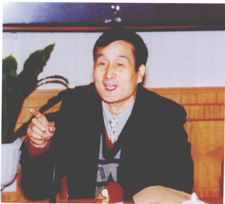
1999年11月4日，作者率研究生到眉山市调研时在采访现场会上讲话