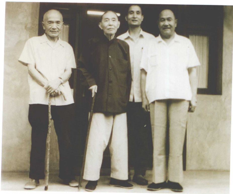
1979年7月，作者在北京采访茅盾时，与茅盾（左二）、 吴伯箫（右一）、楼适夷（左一）合影