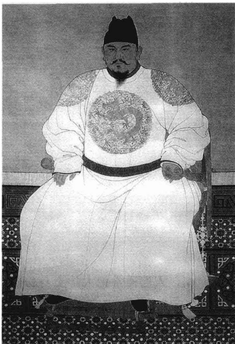
明太祖洪武皇帝 朱元璋画像

纪》载，洪武十一年（1378年），朱元璋曾“命奏事毋关白（告知）中书省”。这显然是裁抑中书省权力的一个措施。但胡惟庸等人却不知收敛，反而变本加厉，组织党羽，在外招集军马，并派人勾结倭寇，又向蒙古贵族残余势力称臣，请兵为外应，阴谋武装政变。洪武十三年（1380年），朱元璋以“擅权植党”罪名诛杀了胡惟庸，并废除中书省及丞相