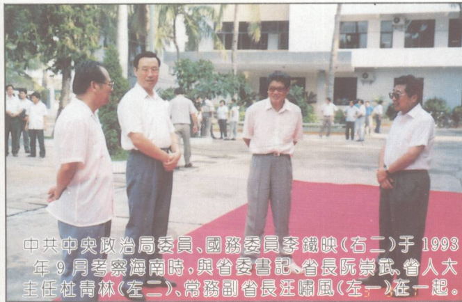
中共中央政治局委員、國務委員李鐵映(右二)于1993年9月考察海南時，與省委書記、省長阮崇武、省人大主任杜青林(左二)、常務副省長汪爾風(左一)在一起。