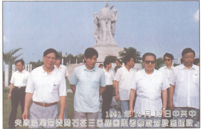
1991年10月12日中共中央政治局常委喬石在三亞鹿回頭考察旅遊設施建設。