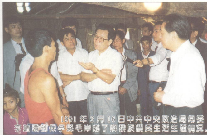
1991年2月16日中共中央政治局常委李瑞環到保亭縣毛岸鄉了解黎族農民生活生產情況。