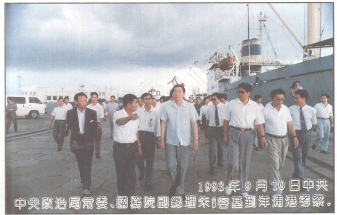
1993年9月10日中共中央政治局常委、國務院副總理朱鎔基到洋浦港考察。