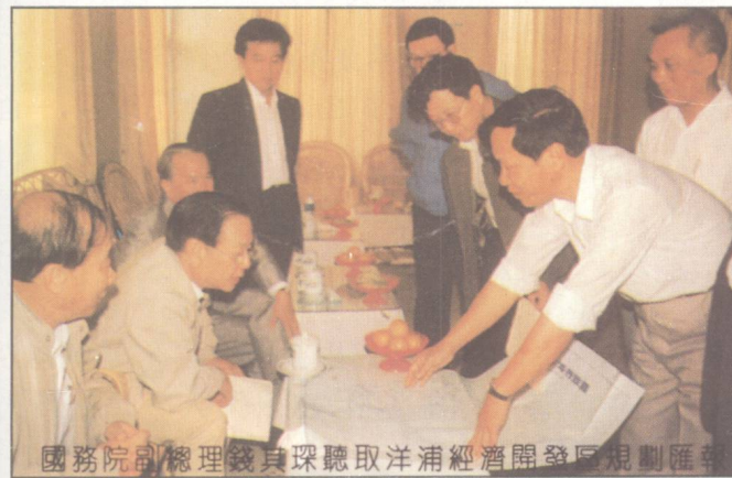
國務院副總理錢其琛聽取洋浦經濟開發區規劃匯報。