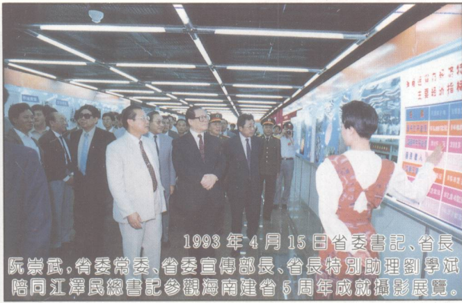
1993年4月15日省委書記、省長阮崇武、省委常委、省委宣傳部長、省長特別助理劉學斌陪同江澤民總書記參觀海南建省5周年成就攝影展覽。