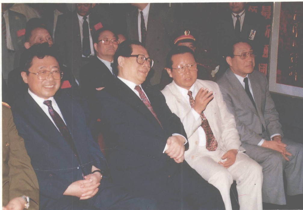
海南省委书记、省长阮崇武(左一)， 省委常委、宣传部长、省长特别助理刘学斌(右二)陪同中共中央总书记、国家主席江泽民(左二)， 国务院副总理李岚清(右一)观看海南建省五周年成就展览。