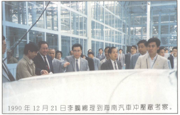
1990年12月21日李鵬總理到海南汽車沖壓廠考察。