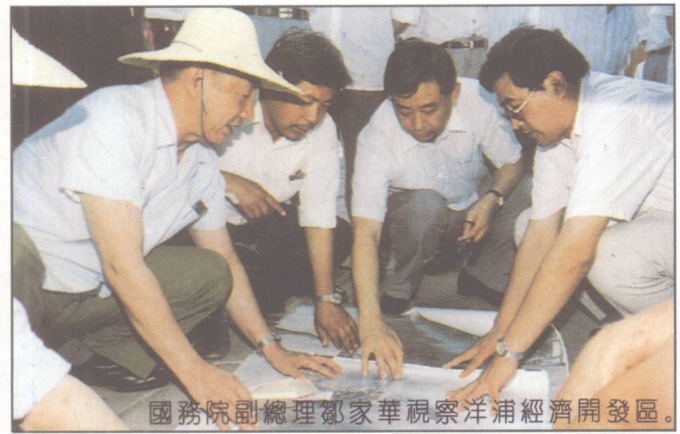
國務院副總理鄧家華視察洋浦經濟開發區。