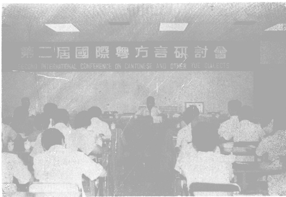
研讨会开幕式后举行的大会宣读论文