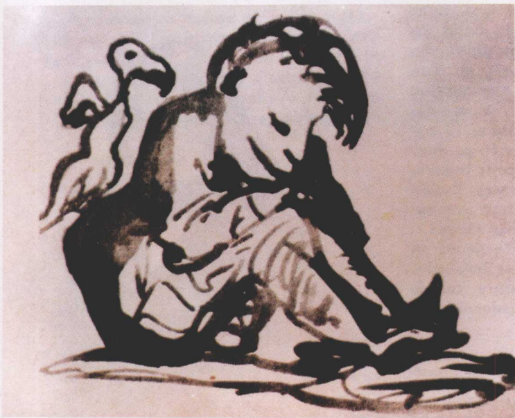
雨果所绘《悲惨世界》中的加弗洛什