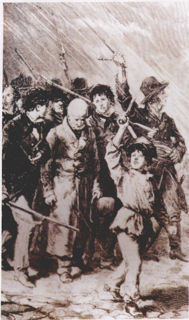
《悲惨世界》插图：起义