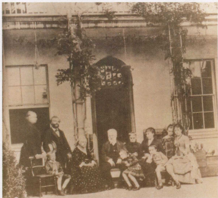
雨果与家人在高城居