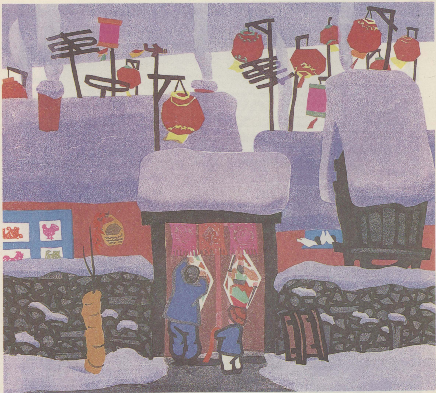
1 新春 (水套木刻) 59×54公分 王晓林