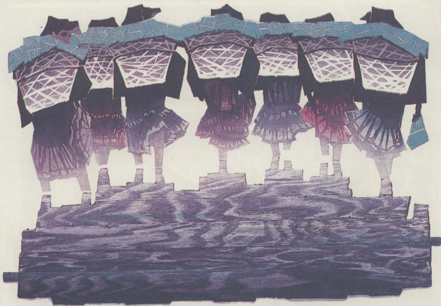
4. 加座 (油套木刻) 37×58公分 邓朝金