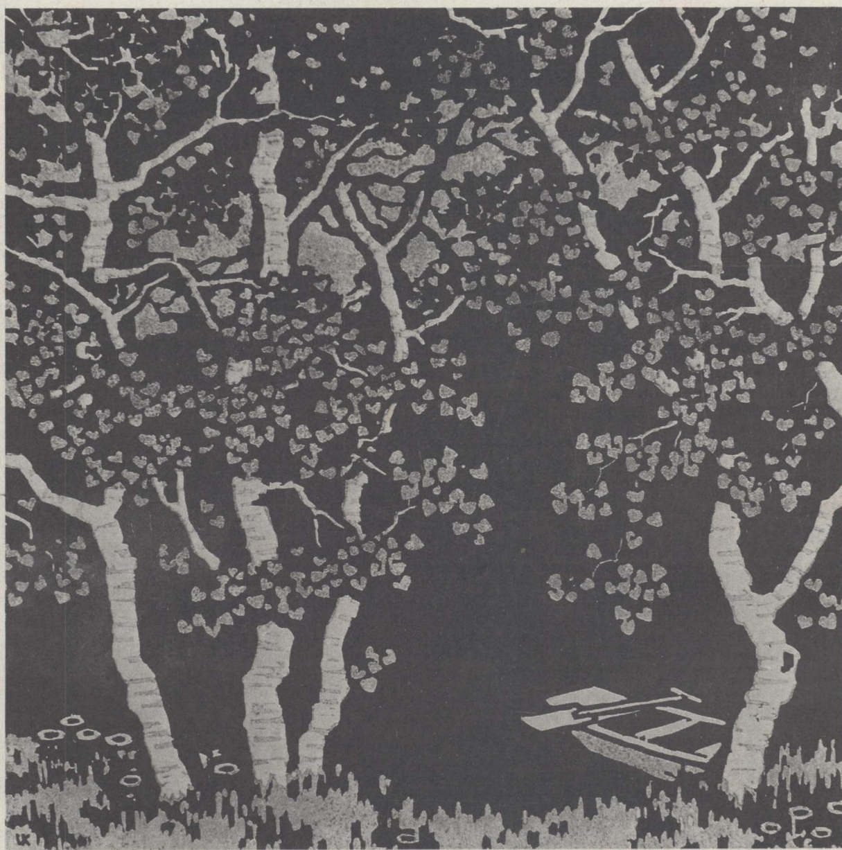
2. 湖 边 (水套木刻) 35×36公分 力 群