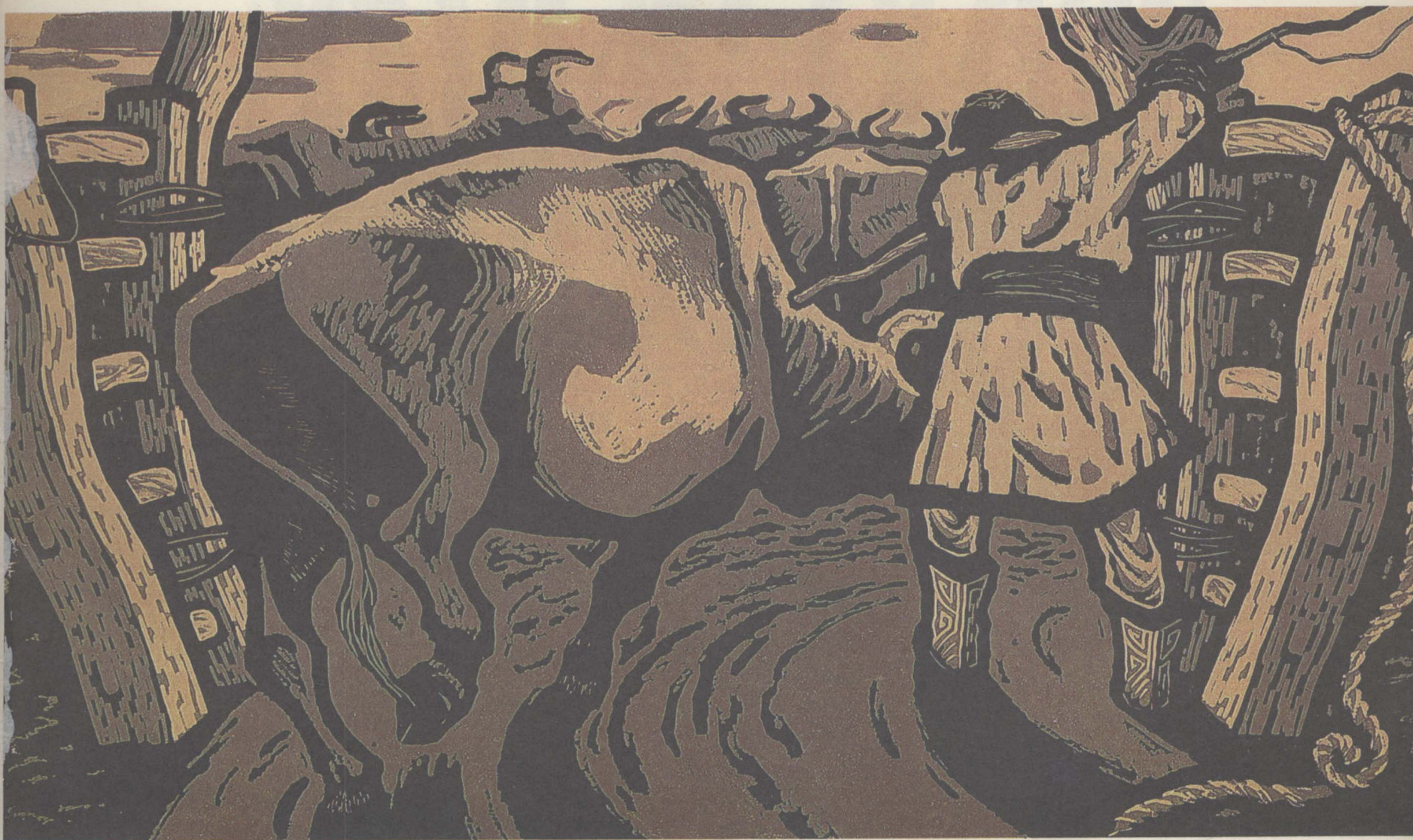
6. 侗家纺织图(黑白木刻) 53×48公分 龙开朗