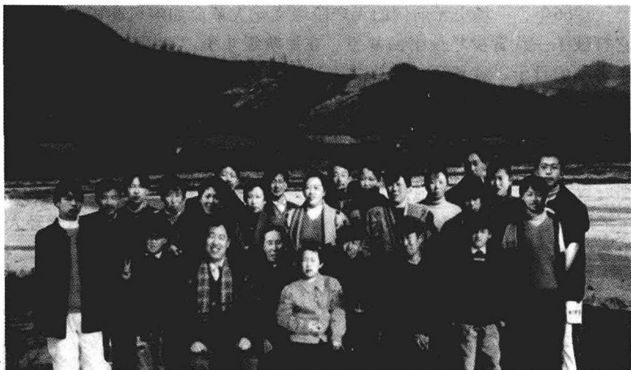
父母抚育下的兄妹6人各家庭的全部阵容（下数一行左二为作者）

有人说，幼年的记忆就如同在豆腐上刻了一个印迹一样，回忆我的童年，少年时期是快乐幸福的。它对我的一生的成长进步是至关重要的。从父母、老师、同学、朋友、图书等以及生命经历磨练中，吸纳沉淀下来的潜质，而在潜质中最突出的是三种元素：自强不息的意志，吃苦耐劳的精神，独立思考的习惯。多年来，我也形成了能吃苦，勇于进取的性格。工作有激情，愿意创新，而不喜欢循规蹈矩地做重复性的工作。