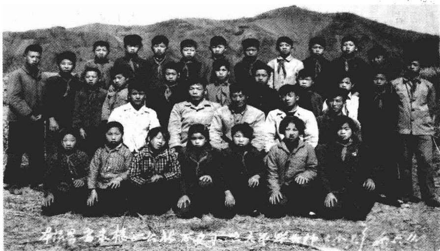
带着少年的梦想告别小学学习生活

因为我喜欢读书，1970年曾被当时下乡在我们队的“五七”干部工作队抓了典型，挨过批，说我追随“封资修”，是资产阶级的小爬虫。几次批判我，还把我的藏书全部收缴。当时我困惑的是，为什么把我的书收走后，不让我看，可他们在看，很多人还把我的书剪了当卷烟纸。每每看到那种场景，真是怒火满腔。