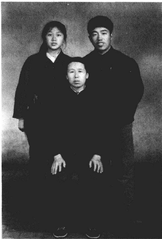
1976年与母亲和三妹在一起