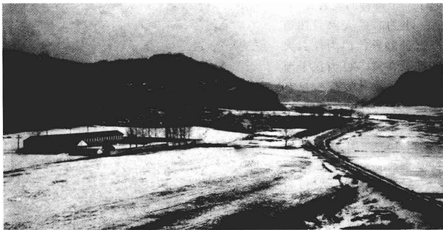
在那遥远的小山村——湾柳河（作者出生地）

我知道人生传奇也好，笔架山也好，柳鱼也好，请乐队也好，其实这与个人的成长没有必然的联系的话，不过是一种巧合罢了。如果非要联系，父母经常的念叨，也许会起一种心理暗示的作用。但这不是根本原因，真正对我产生影响的是父母那种自强不息，吃苦耐劳，与命运抗争的精神。是正直、善良、自尊、刚强，“宁折不弯”性格的传承，是从小严格的家庭教育为我打下了人生的底色，这是最大的一笔财富。是我取之不尽用之不竭的无价之宝。