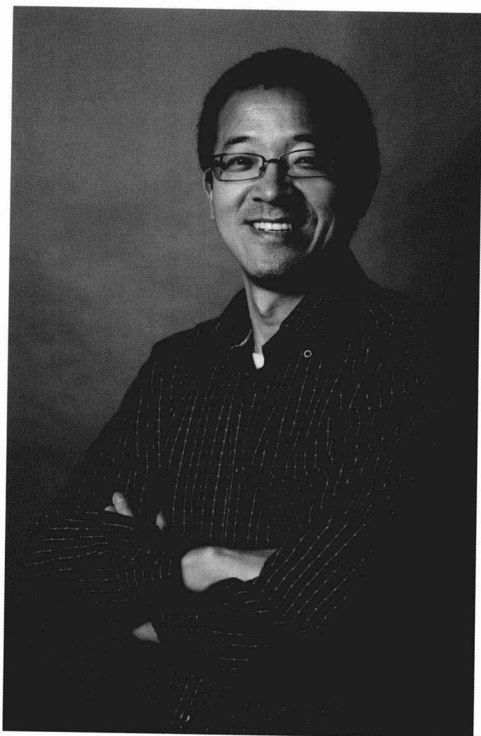
俞敏洪 新东方集团董事长