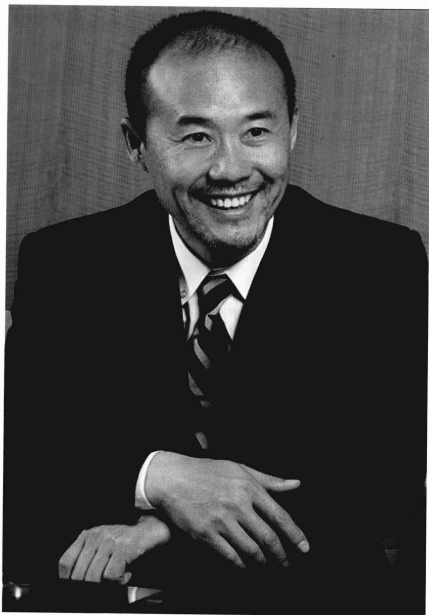
王石 万科 集团董事长