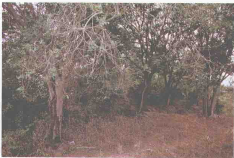
旧平坝上寨“龙山”上的“龙树” (树下残留的香棍、石块即为拜祭痕迹)