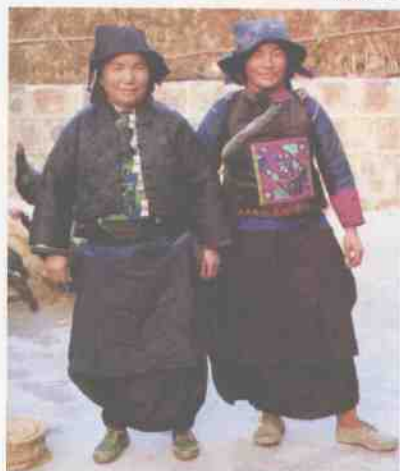
壮族(土支系) 妇女服饰