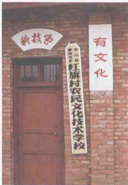
旧平坝上寨村民进行文化 技术培训的业余技术学校