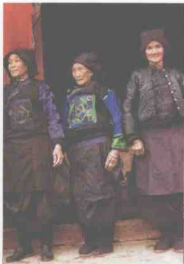
壮族(土支系) 妇女上衣的前襟