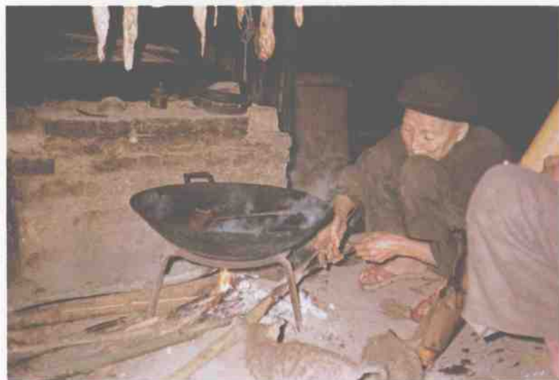
壮族（土支系）老人与火塘