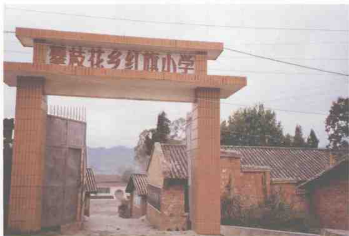
文山县攀枝花镇红旗办事处的红旗小学