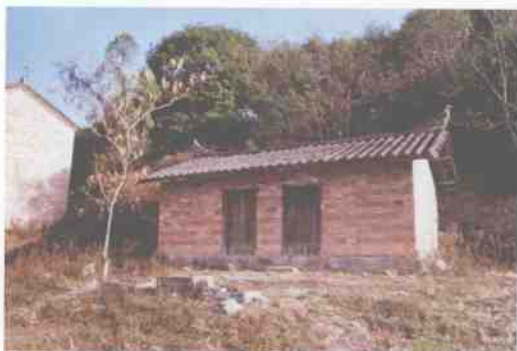
旧平坝上寨的寨庙 ——左为观音庙，右为土地庙