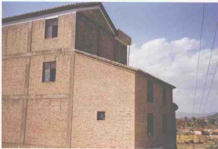
旧平坝上寨现代化的砖混结构民居