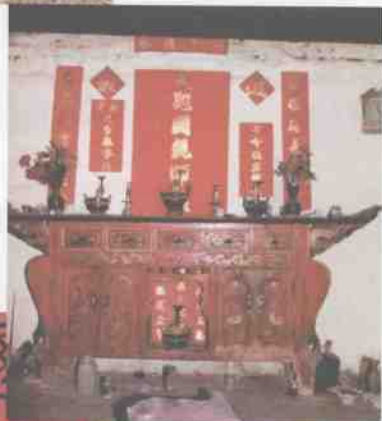
旧平坝上寨韦氏家族的 祖先、土地牌位