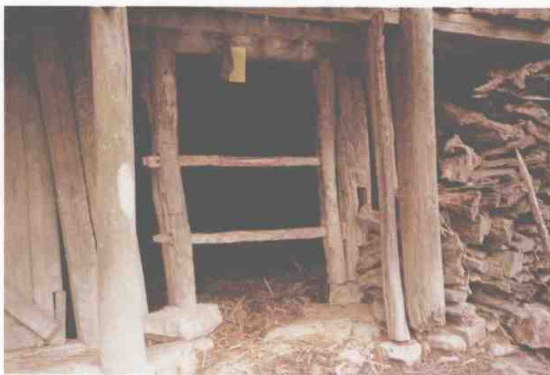
旧平坝上寨村民家中牲畜厩门上的“封门”图符