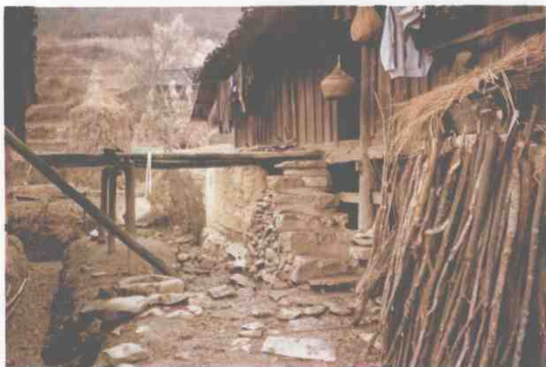
传统的壮族（土支系）干栏式民居