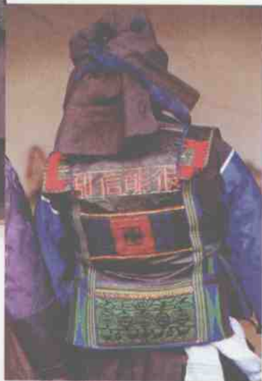
壮族(土支系) 妇女上衣的 后襟——“后补”