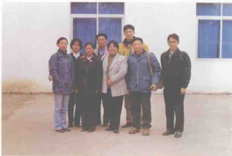
壮族调查组成员与当地干部合影