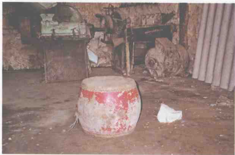
壮族（土支系）用于人死后报丧的“丧鼓”