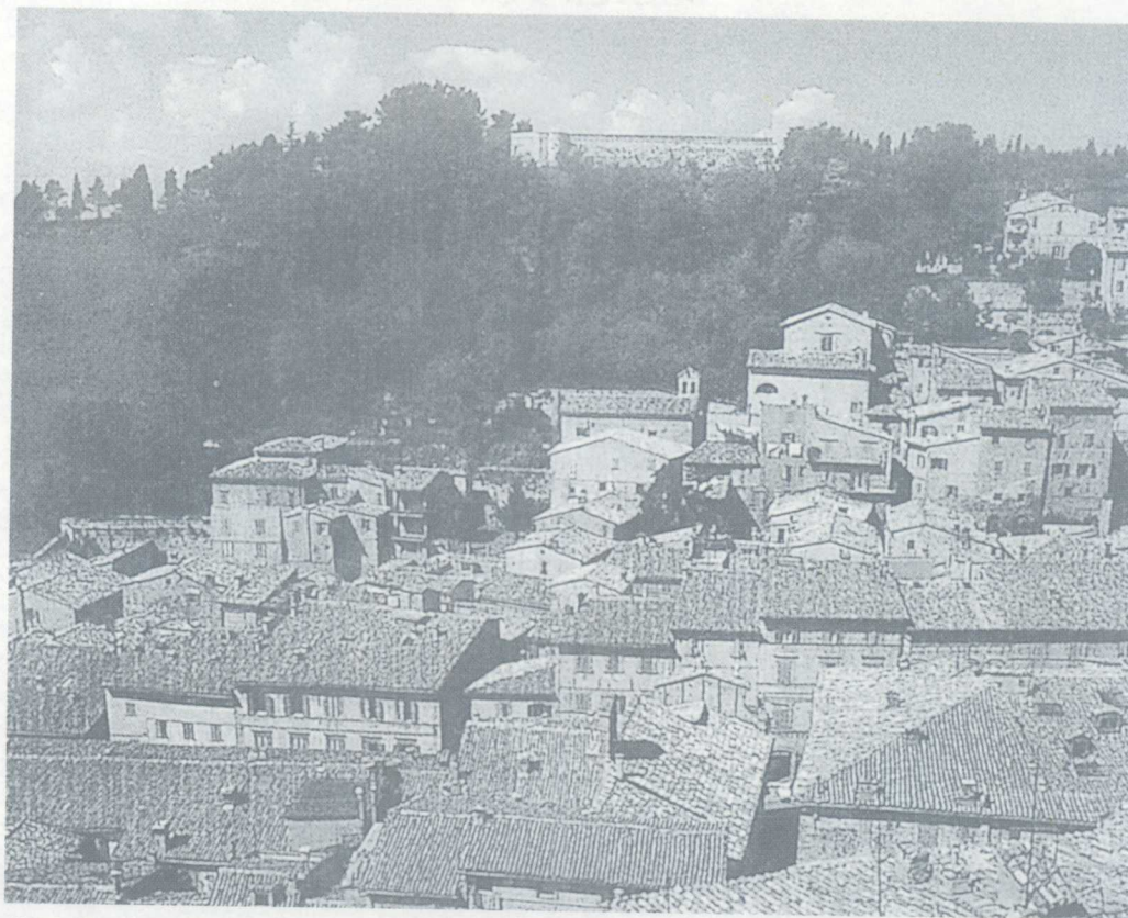
拉斐尔故乡乌尔比诺城

乌尔比诺是意大利中部临亚得里亚海的一座美丽的海滨城市，整座城市就像是一幅天然油画：这一边，连绵起伏、奇形怪状的亚平宁山脉高耸入云；那一边，亚得里亚海的碧波隐约可见。而山城本身又是一座绘画、雕塑和建筑保存完好的文化古城。这一切，使山城拥有了“艺术家之乡”的美名。在这片丰饶的土地上，诞生了一位伟大的艺术家——拉斐尔。