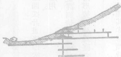
第二圖 縱平窿之開掘