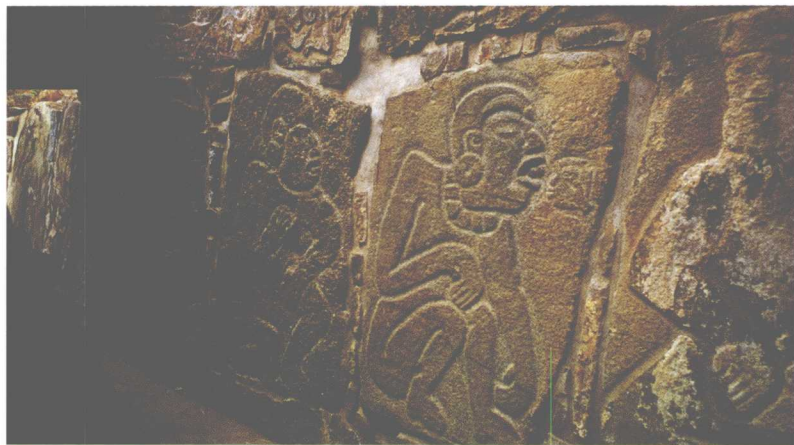
蒙特·阿尔万的浮雕（公元前5世纪）

说起人类古代文明，你可能会立即想到东半球的古埃及、古巴比伦、古希腊、古印度和中国等世界古代文明发源地。实际上，西半球同样也有灿烂辉煌的古代文明，其中墨西哥的古代文明堪与东半球的古代文明相媲美，令人刮目相看。