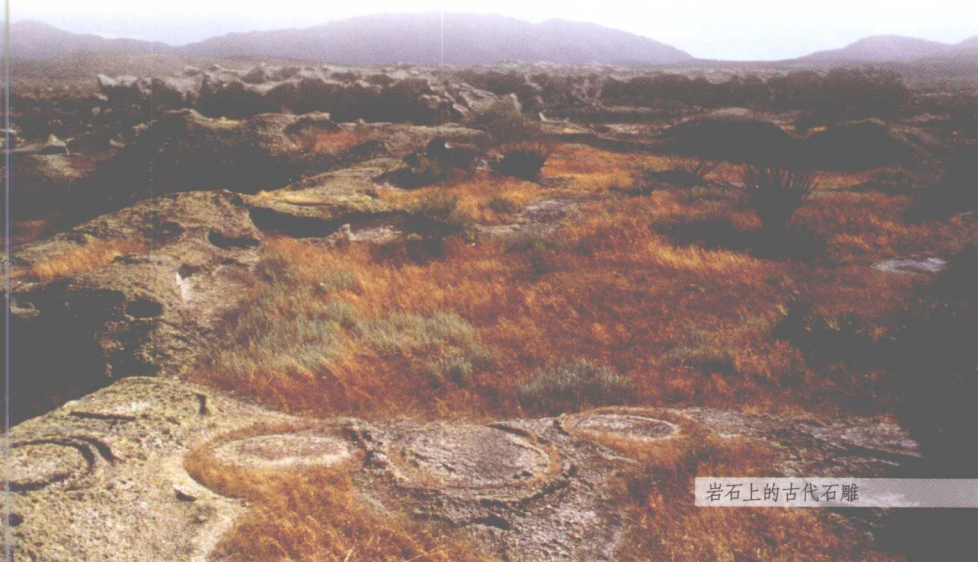
岩石上的古代石雕

美洲古代文明为后人留下了许多宝贵的遗产，对人类文明的发展做出了不可磨灭的贡献。墨西哥是当之无愧的美洲文明古国。墨西哥人民有理由为此而感到自豪。