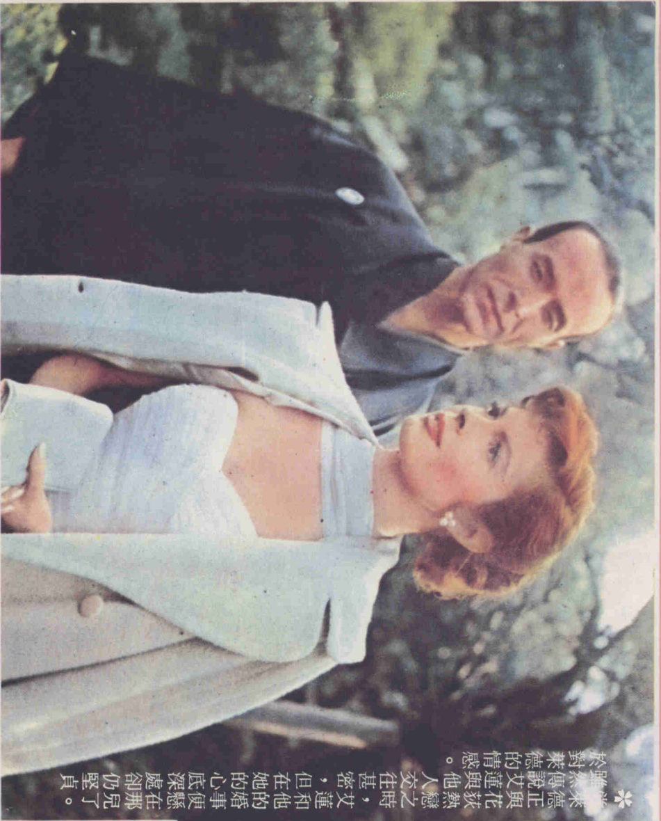
* 雖然艾蓮正與花狹熱戀之時，艾蓮和他的婚事便懸在那兒了。於對萊德的情感。他人在她的底深處卻仍堅貞。