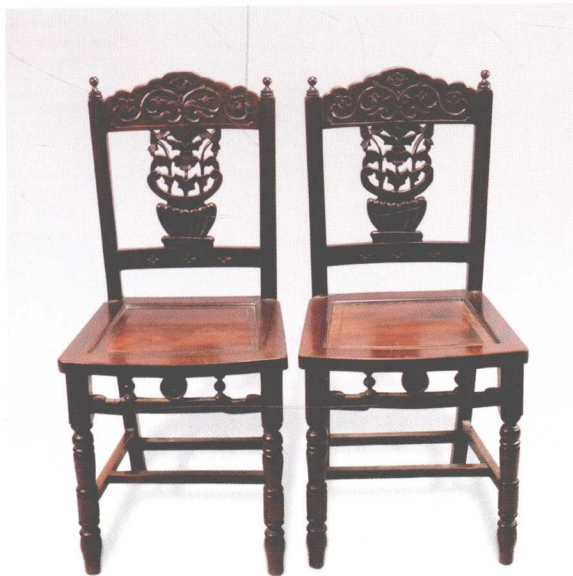
红木雕花“哥特复兴式”靠背椅（1对）