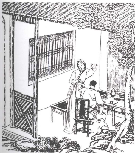
清末《点石斋画报》中的靠背椅