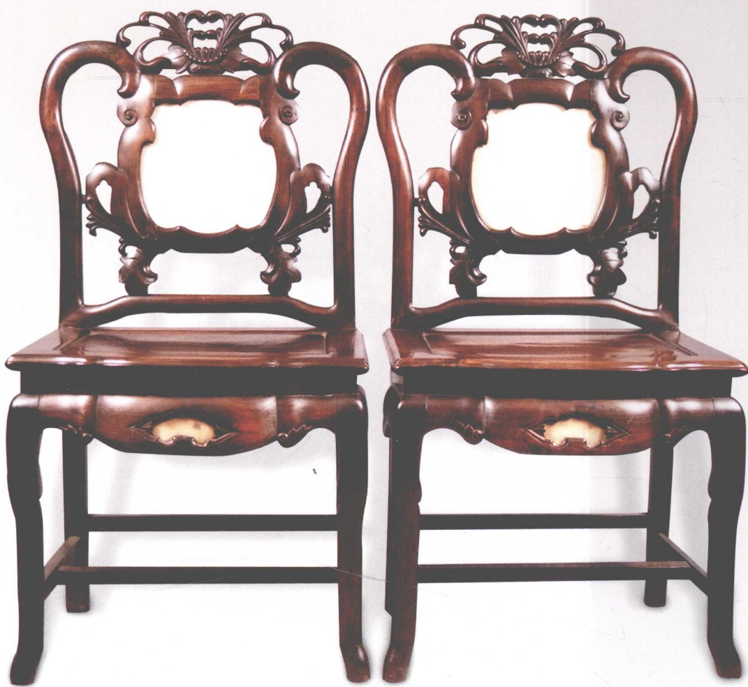
红木透雕嵌理石束腰靠背椅（1对）