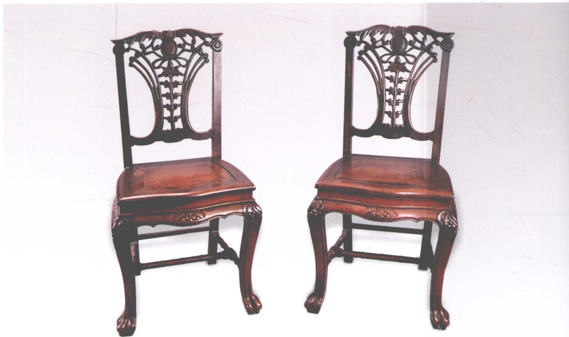
红木雕花纹束腰兽足“齐蓬代尔式”靠背椅（1对）