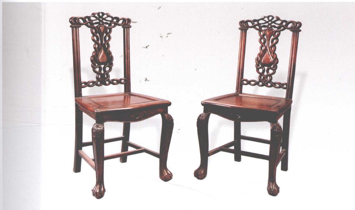
花梨木雕盘肠纹束腰三弯腿兽足靠背椅（1对）