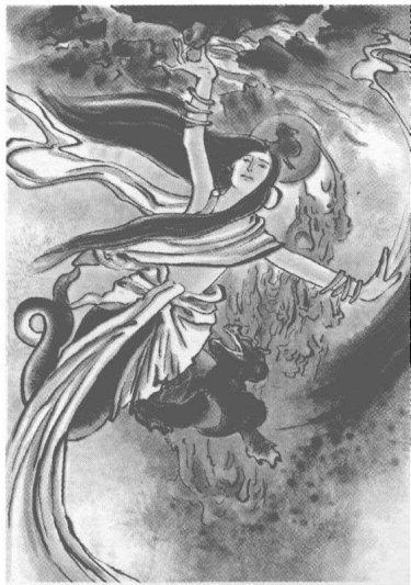
女娲手拿五色石炼成的石浆，飞向天空，去堵天空的窟窿。

看到人类遭受如此大的灾祸，女娲痛苦万分，决心拯救人类。她把五色石子投入火中炼成石浆，再用石浆去堵住天空的窟窿；又用树木燃烧的灰烬来填充地面的洞穴。经过一番辛劳，女娲把天补好了。洪水不再泛滥，地火不再蔓延，野兽也逃跑了，世界又恢复了太平。