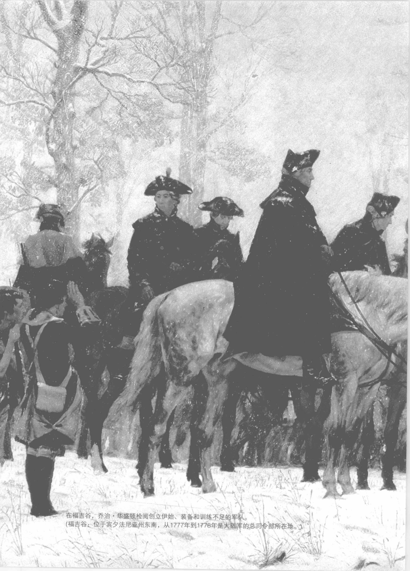
在福吉谷，乔治·华盛顿检阅创立伊始、装备和训练不足的军队。 (福吉谷：位于宾夕法尼亚州东南，从1777年到1778年是大陆军的总司令部所在地。)