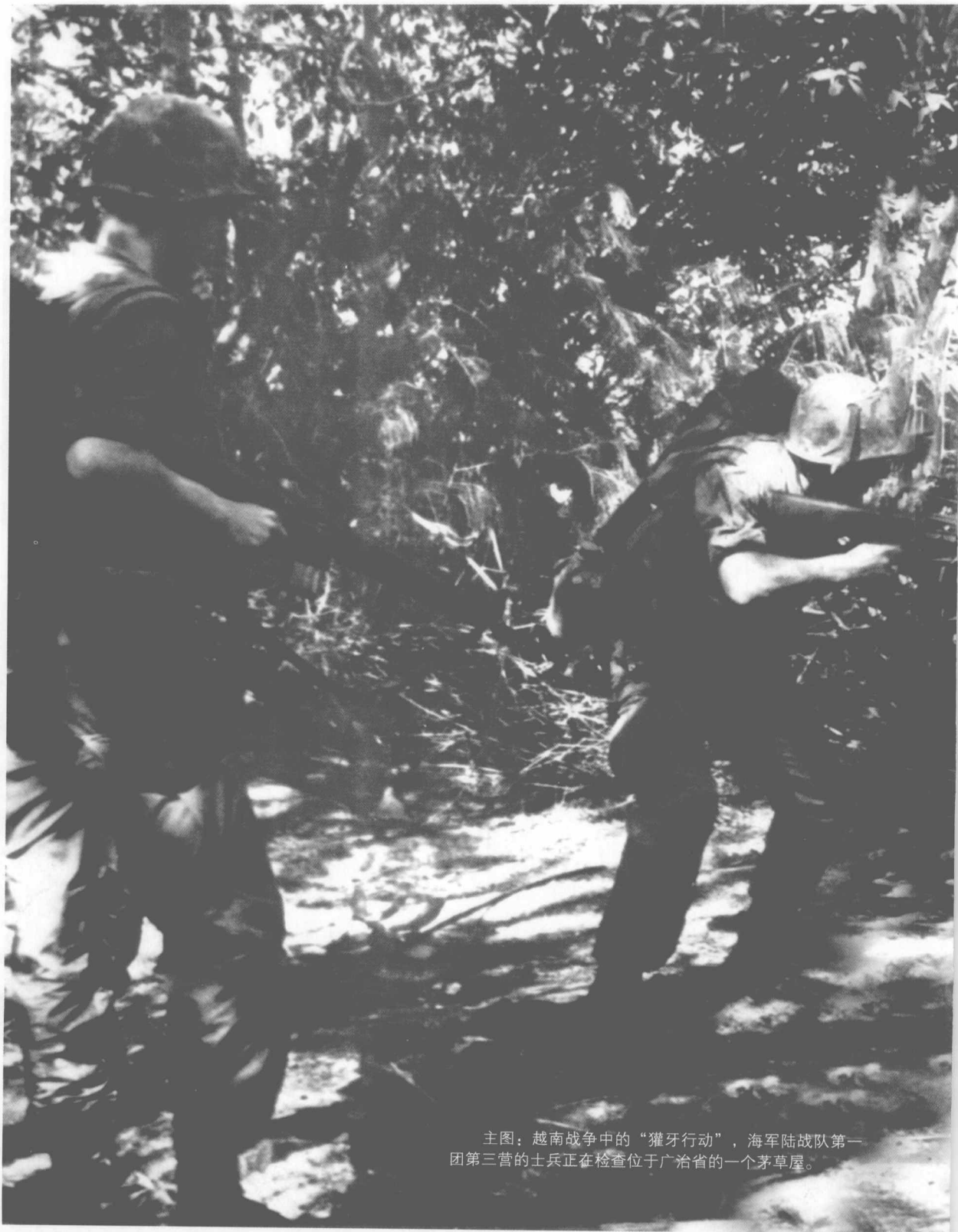
主图：越南战争中的“獠牙行动”，海军陆战队第一团第三营的士兵正在检查位于广治省的一个茅草屋。