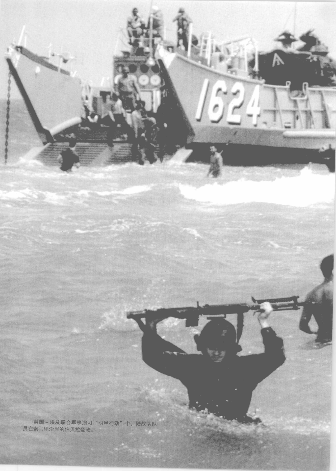
美国 - 埃及联合军事演习“明星行动”中，陆战队员在索马里沿岸的伯贝拉登陆。