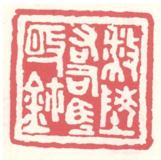
放陵右司馬之故鉢