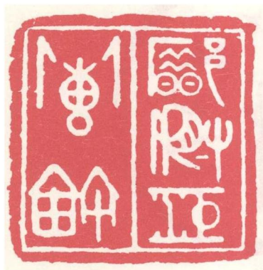
郟 汜 铎