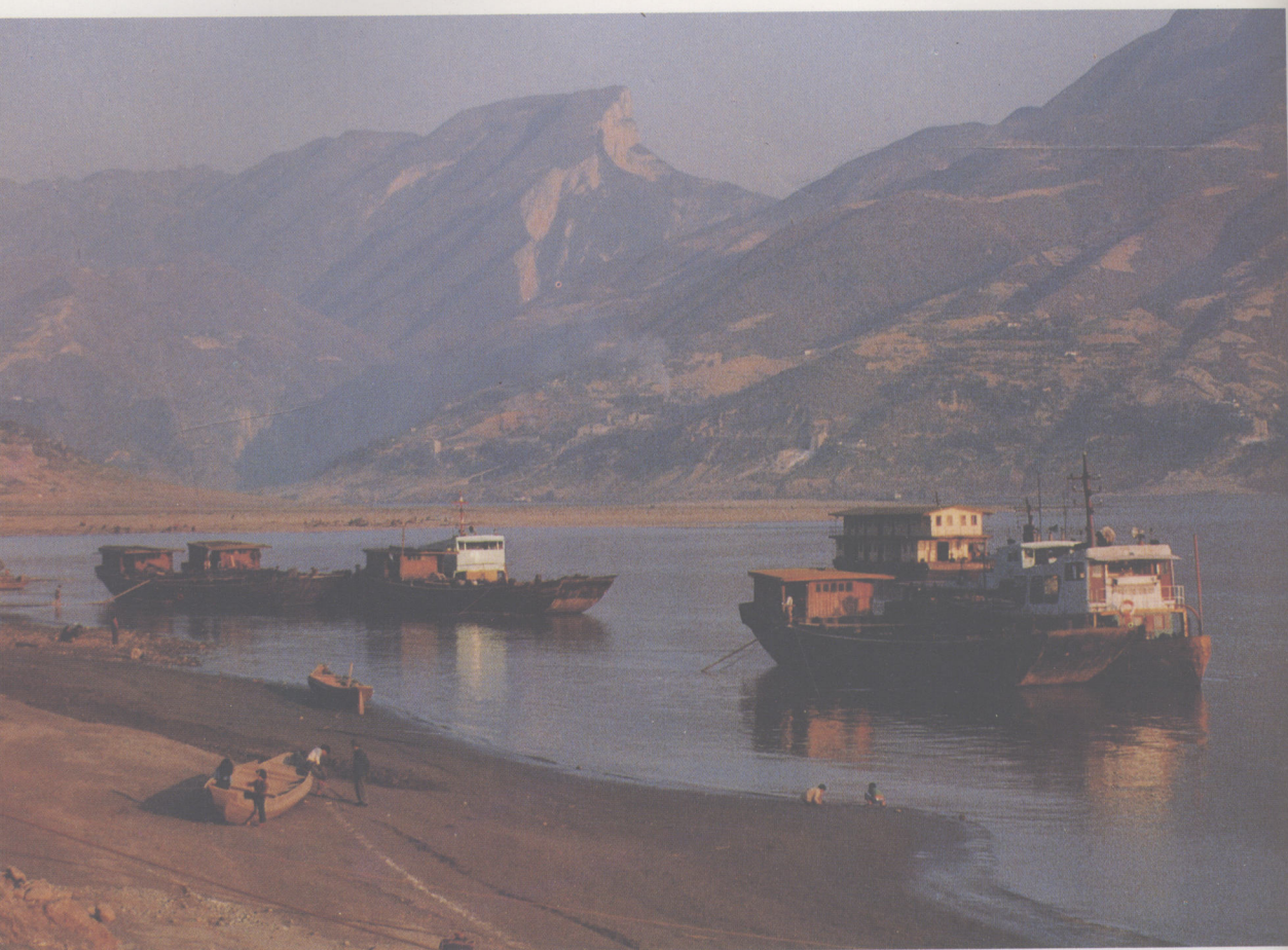
2、从白帝城眺望长江（1987年11月）