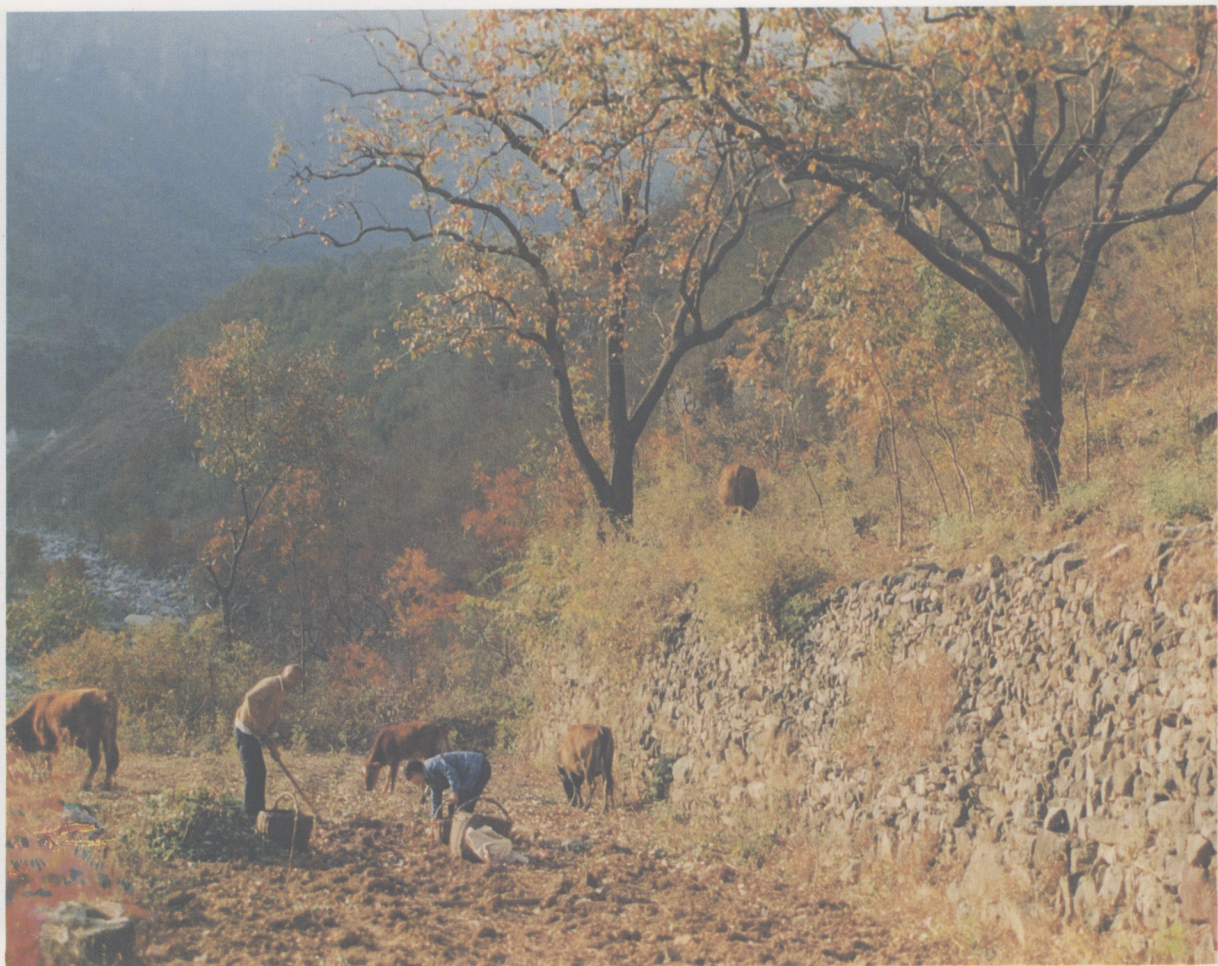
10、莫非进入“桃花源”（1989年10月）