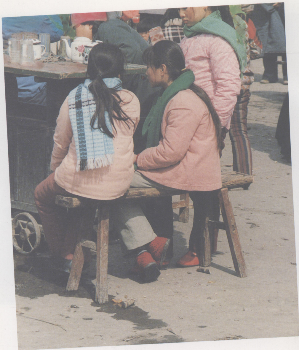
4、来自乡村的姑娘 (1988年3月)