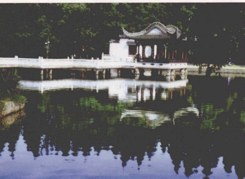
安徽琅琊山醉翁亭