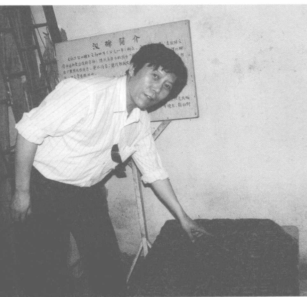
在河北封龙山访汉碑