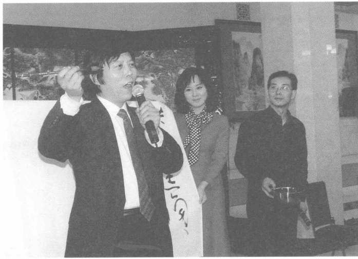
在中国书协新年团拜会上边写边唱