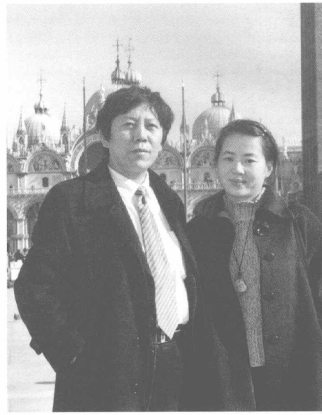
与夫人乙庄在威尼斯