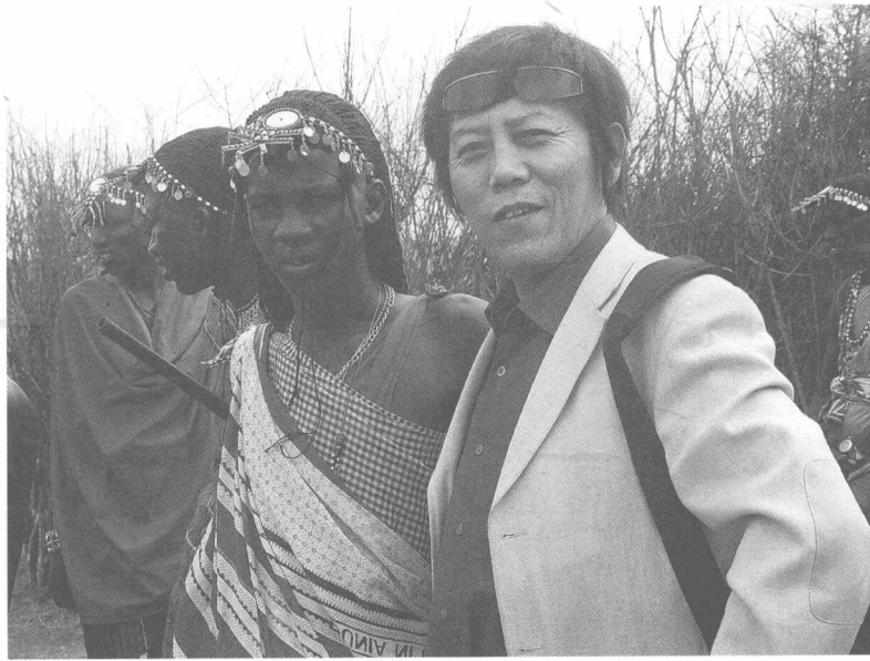
赴非洲与马赛人在一起