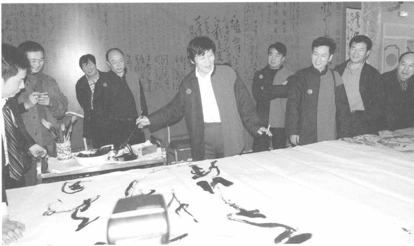
在快哉快哉雅集现场挥毫