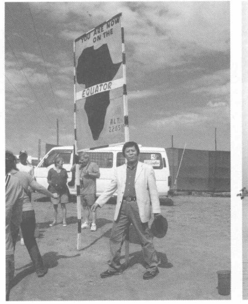
泥脚一双两半球（跨越赤道）