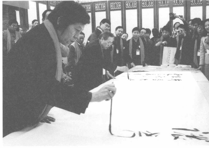
在人民大会堂参加慈善笔会