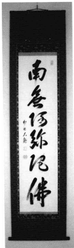
南无阿弥陀佛(有马赖底 手书)