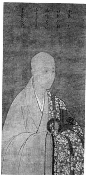
日本相国寺开山祖师梦窗疏石顶像及手书“别无工夫”