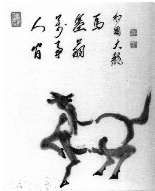
人间万事塞翁马(有马赖底 手绘)