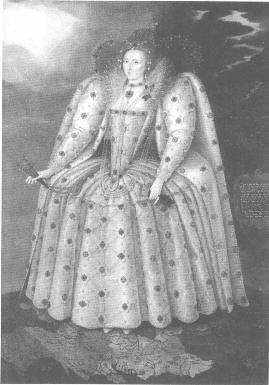
伊丽莎白一世，又被称为处女女王或圣洁女王，她有力地推动了当时的英格兰在政治商业和艺术上的优势地位，其在位期间被称为伊丽莎白时代