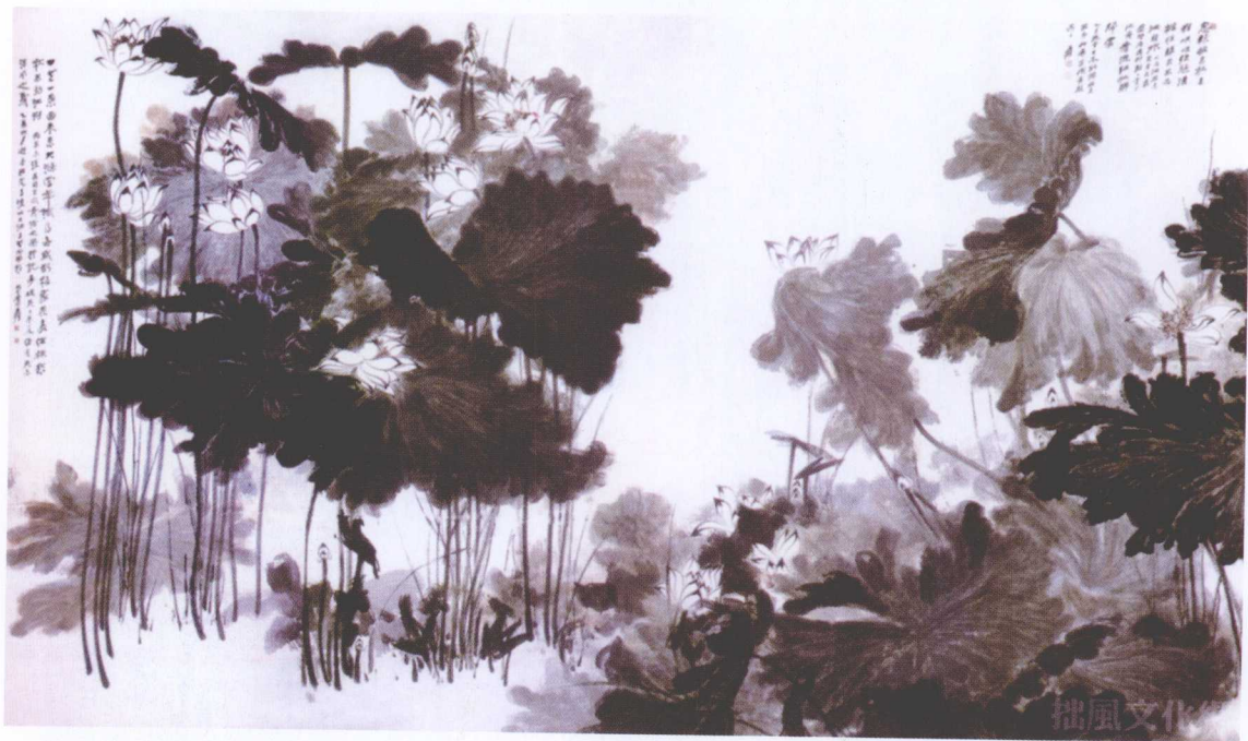
图 1-3 国画-荷花（作者：张大千）

中国是一个色彩古国，几千年来，在中国传统绘画中，色彩的演绎与发展有着自己独特的规律和法则。中国画讲究“随类赋彩”的同时，还十分重视空间环境对物象的影响。随着空间环境对物象的影响，随着空间环境和光源色的变化，物象的色彩也会随之发生变化，这就是我们常说的物体色、环境色、光源色之间的相互作用和影响。中国画和油画在色彩运用和对色彩的感受上是有所区别的。中国传统的绘画是以墨调色，在薄与厚、深与浅、淡与浓等多种矛盾体中求得视觉上的最终统一，如图1-3所示。这与西方绘画以油色烘染出的立体感、明暗透视等有很大的差异。在传统油画（如图1-4所示）技法中，色彩的影响力也是极为显著的，画家可以凭借理解、想象来充分地表达自己的感受，以显露其自身的魅力和美感。