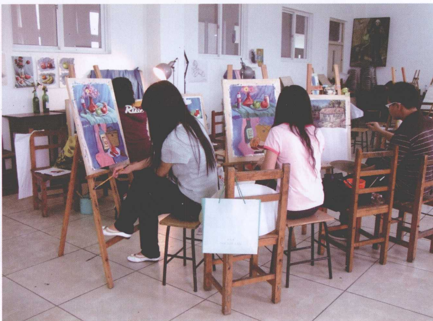
图 2-1 画室简单静物写生训练

在教学中往往将画室的窗户用厚窗帘遮挡起来，其目的是使室内的光线更加集中，这样有利于在不变的光源下研究光源色、固有色和环境色之间的相互变化关系，如图 2-1 和图 2-2 所示。