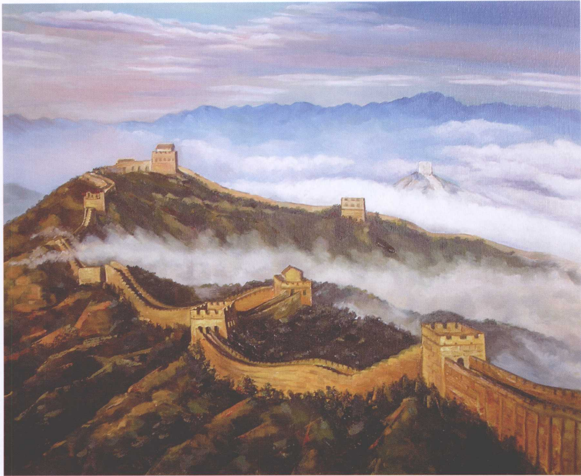
图 1-6 油画-雾锁长城（作者：王忠恒）

虽然自然界的色彩为我们的视觉提供了丰富的色彩资源，并呈现出千差万别的色彩相貌，但是我们的感性认识与理性认识总是在不断提高和变化的，特别是在长期的实践中，人们不仅认识到色彩的差异性，同时也认识到了它的统一性与协调性，这种色彩中既对立又统一的特点构成了绘画色彩的基本关系，成为掌握绘画色彩关系的关键。色彩已成为我们表现自然和情感的重要手段，这就要求我们要不断总结经验，勤于实践，只有这样才能更好地驾驭色彩，才能把自然色彩转化为绘画色彩，才能设计出最理想的色彩画面和艺术作品。因此，用色彩去研究造型是画家和设计师的共同需要。