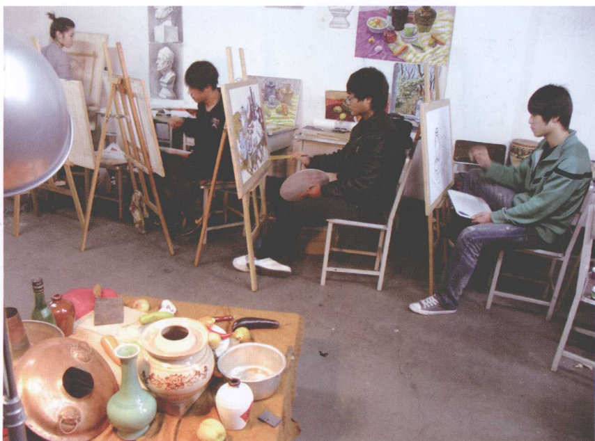
图 2-2 画室复杂静物写生训练