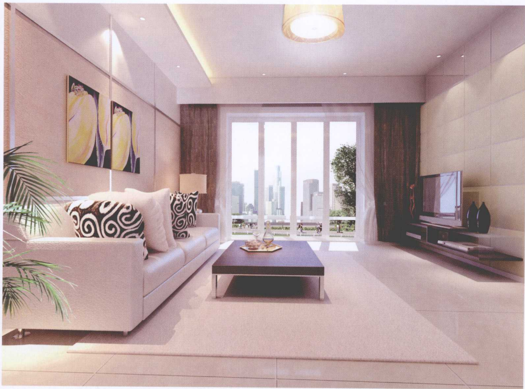
图 1-5 室内设计作品（作者：王宏）

从绘画色彩和色彩的基本概念中，不难得出设计色彩的含义，第一，设计色彩就是要真实地反映物象的色彩面貌，也就是真实性；第二，要求画面效果具有适应时代特点的文化内涵，即审美性；第三，设计色彩应具有突出专业性的特点和功能的实用性，如图 1-5 所示；第四，必须是建立在现代科学研究基础之上的，即科学性；最后，设计色彩还要有前瞻性和创造性。