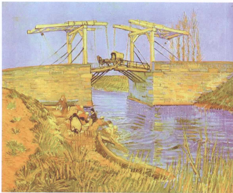
图 1-2 油画—兰格罗瓦桥（作者：梵高）