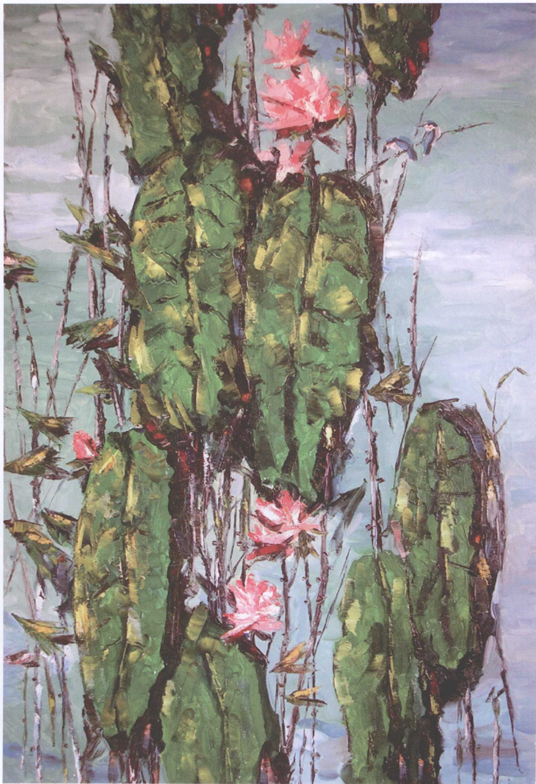
图 1-4 油画-荷塘双栖（作者：王忠恒）