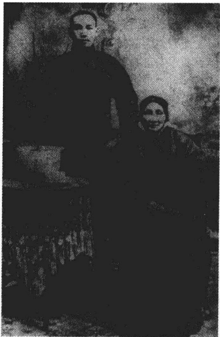
蒋介石与母亲王采玉的合影