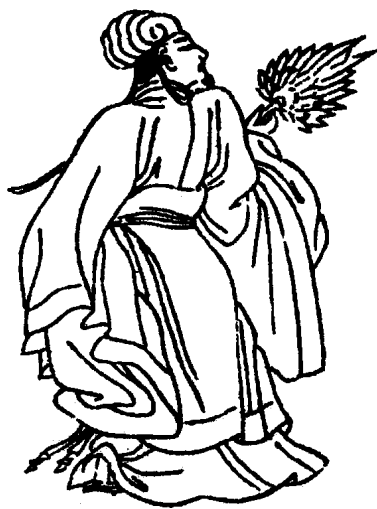
魏豪如行云流水， 孔明潇洒风姿和超人智慧跃然纸上。