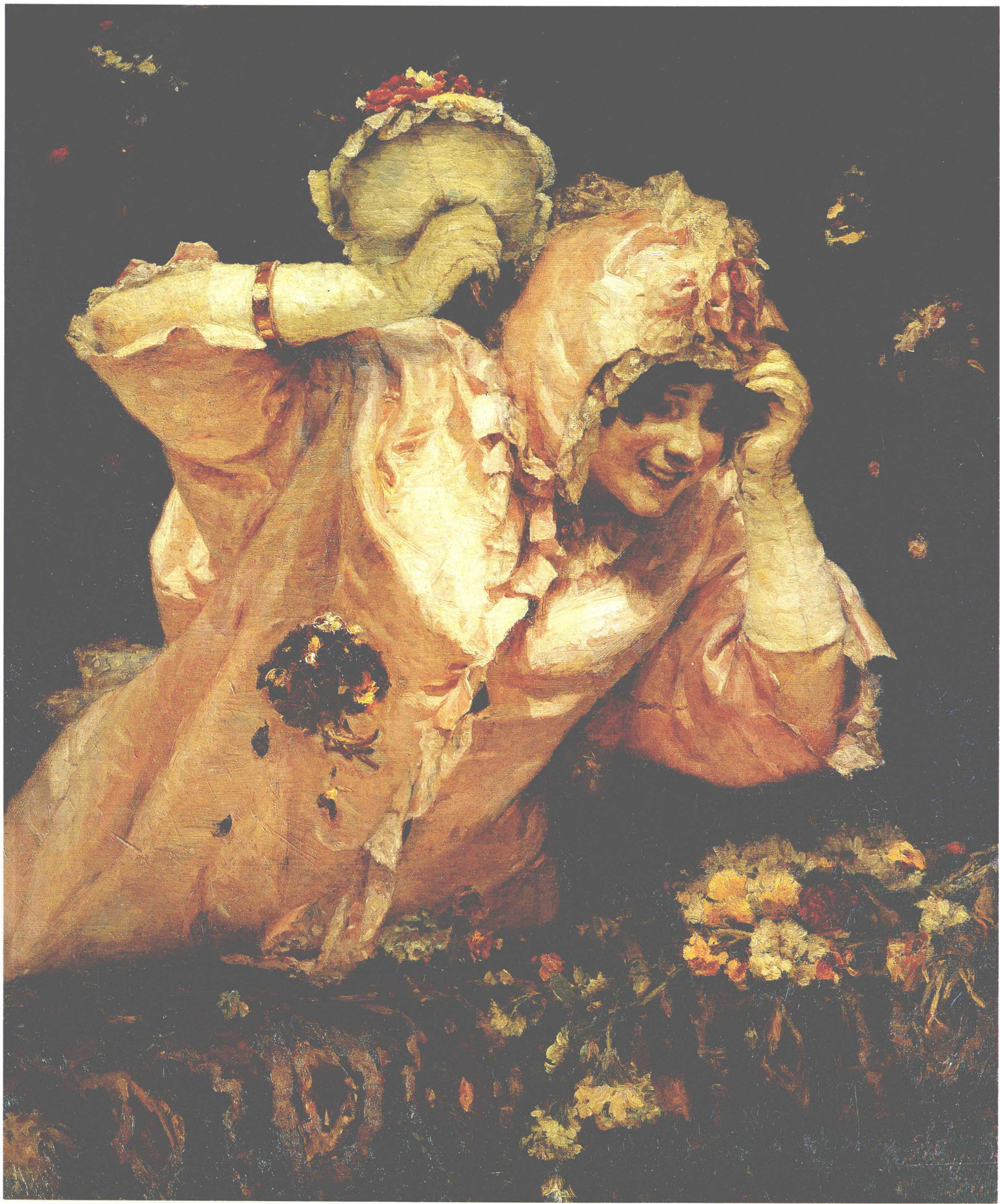
罗马狂欢节的场面 1884年 108cm×93cm