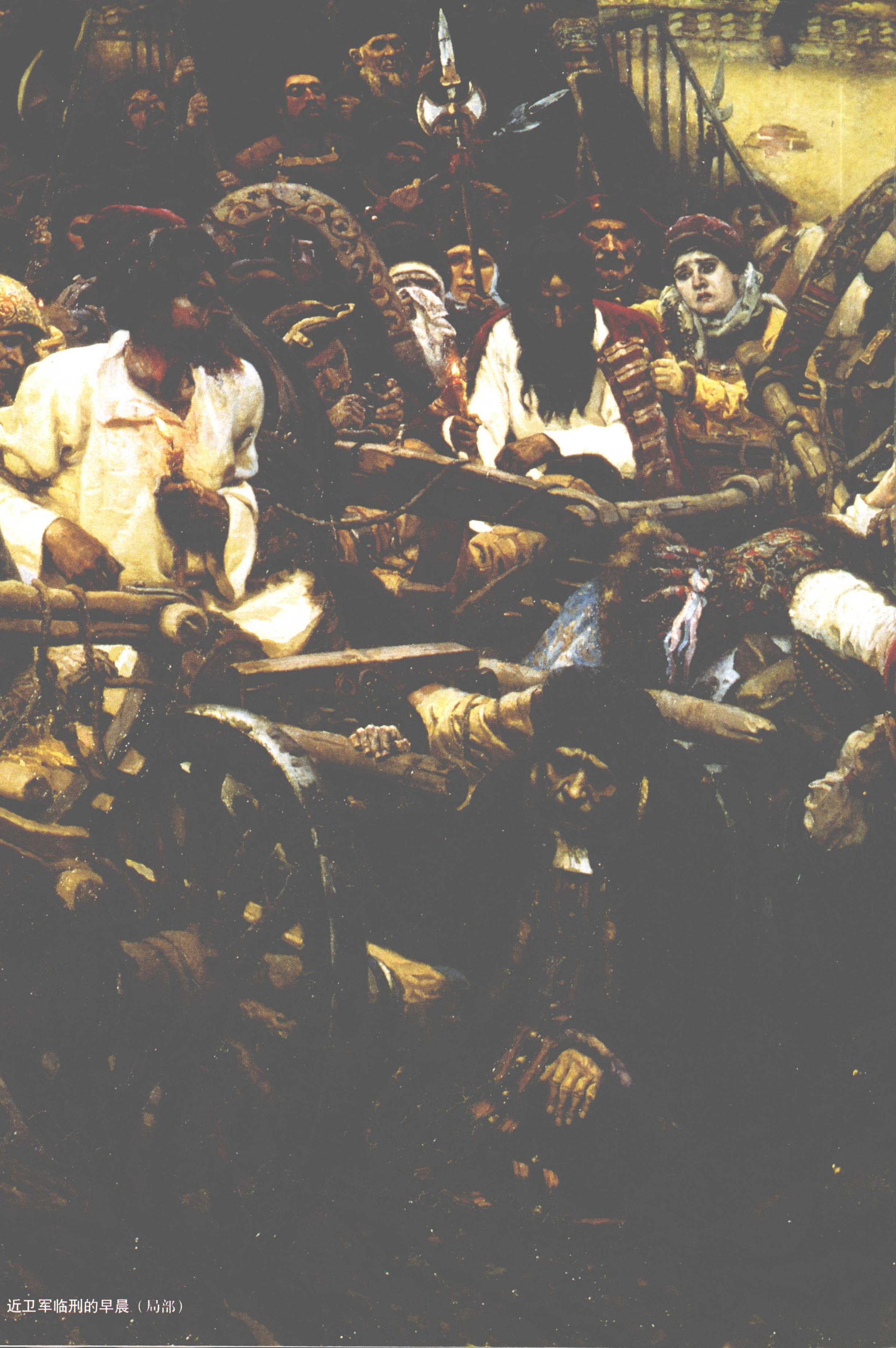
近卫军临刑的早晨（局部）