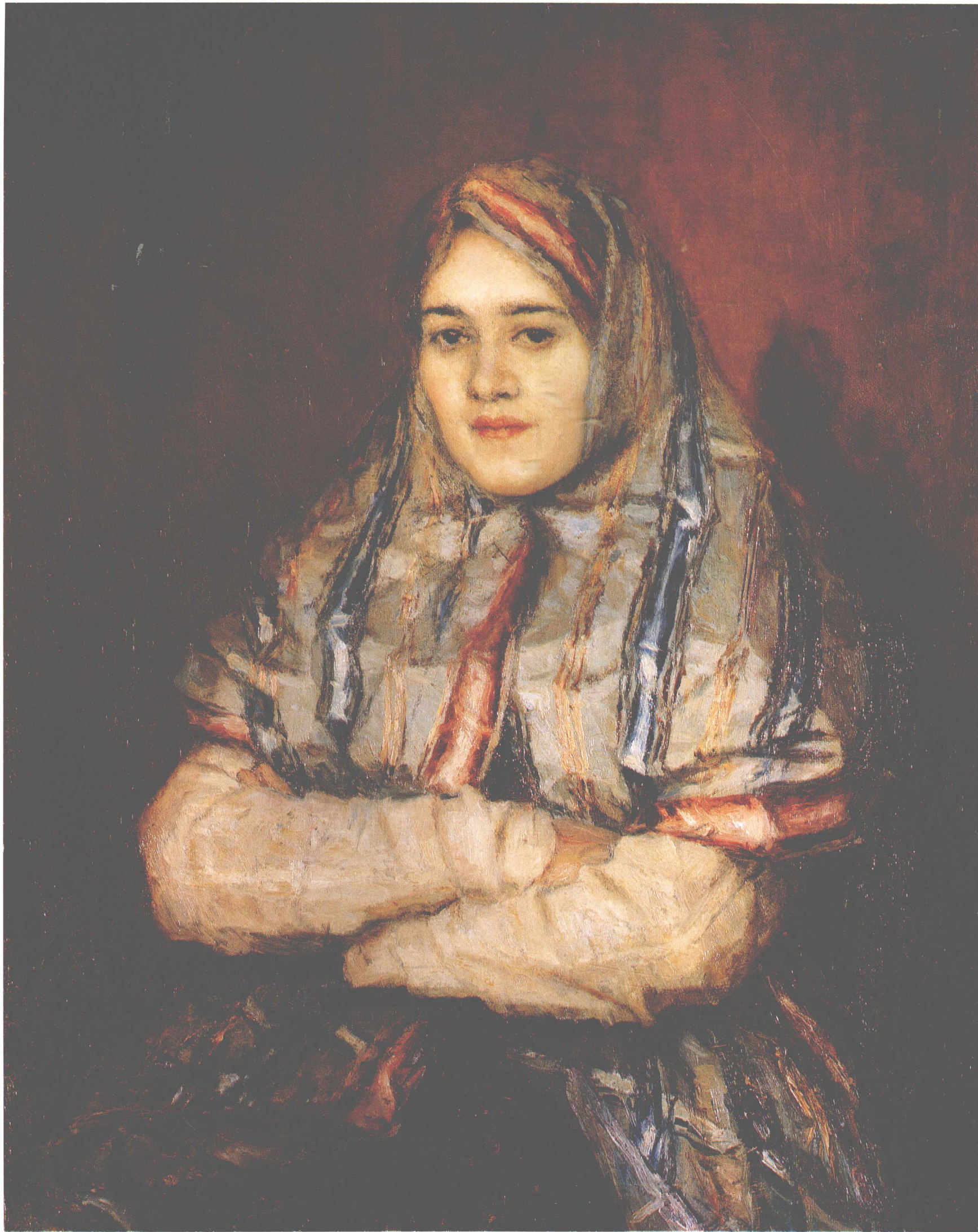
叶梅里亚诺娃像 1902年 82cm×67.4cm