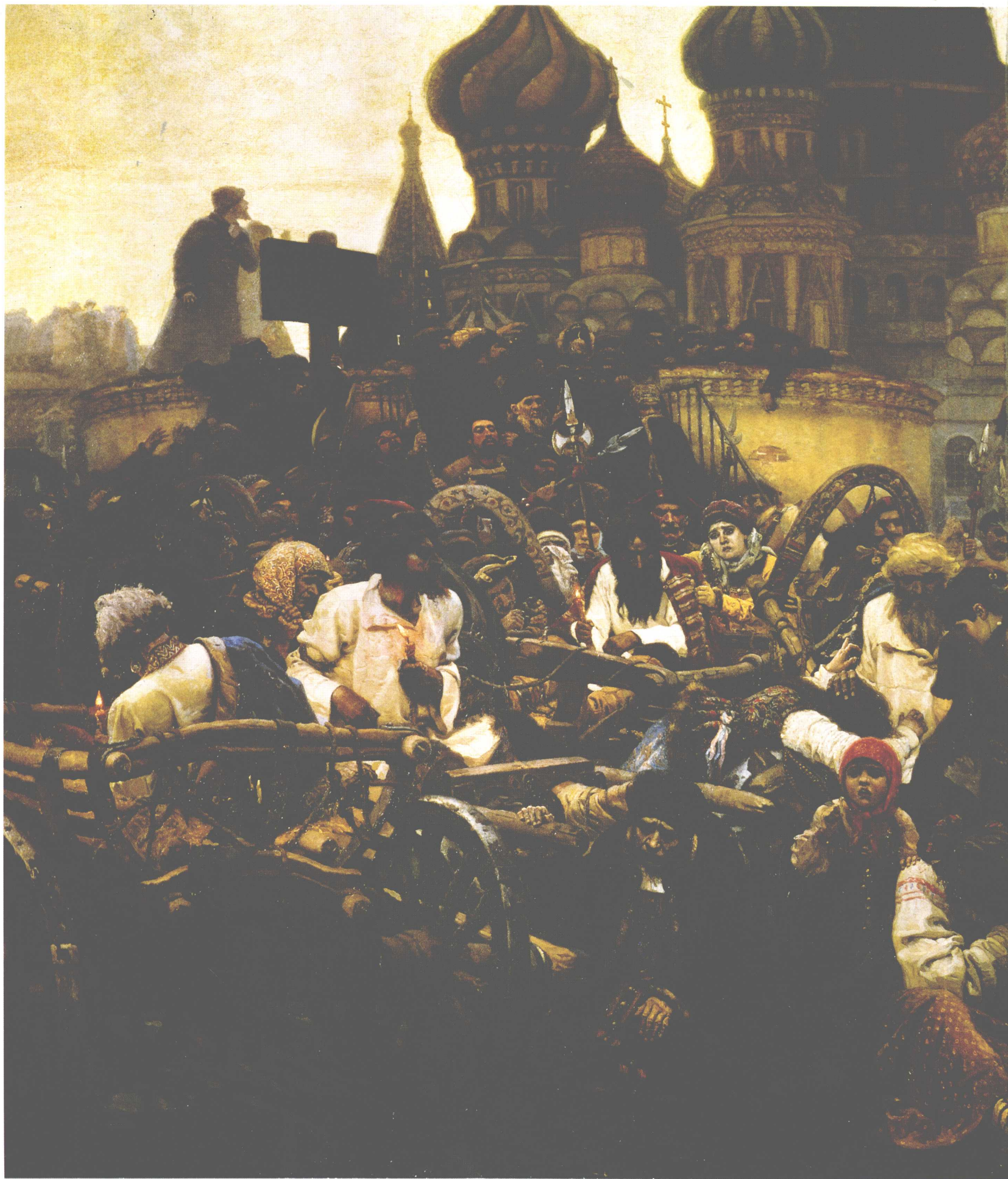
近卫军临刑的早晨 1881年 218cm × 379cm