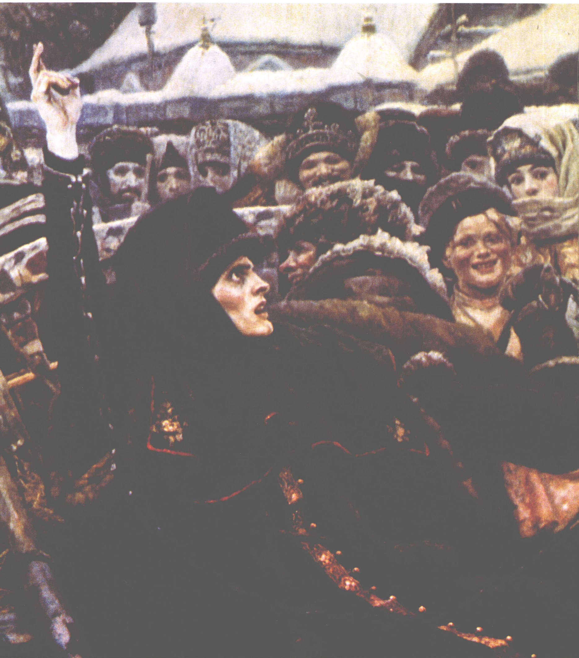
女贵族莫洛卓娃（局部之一）