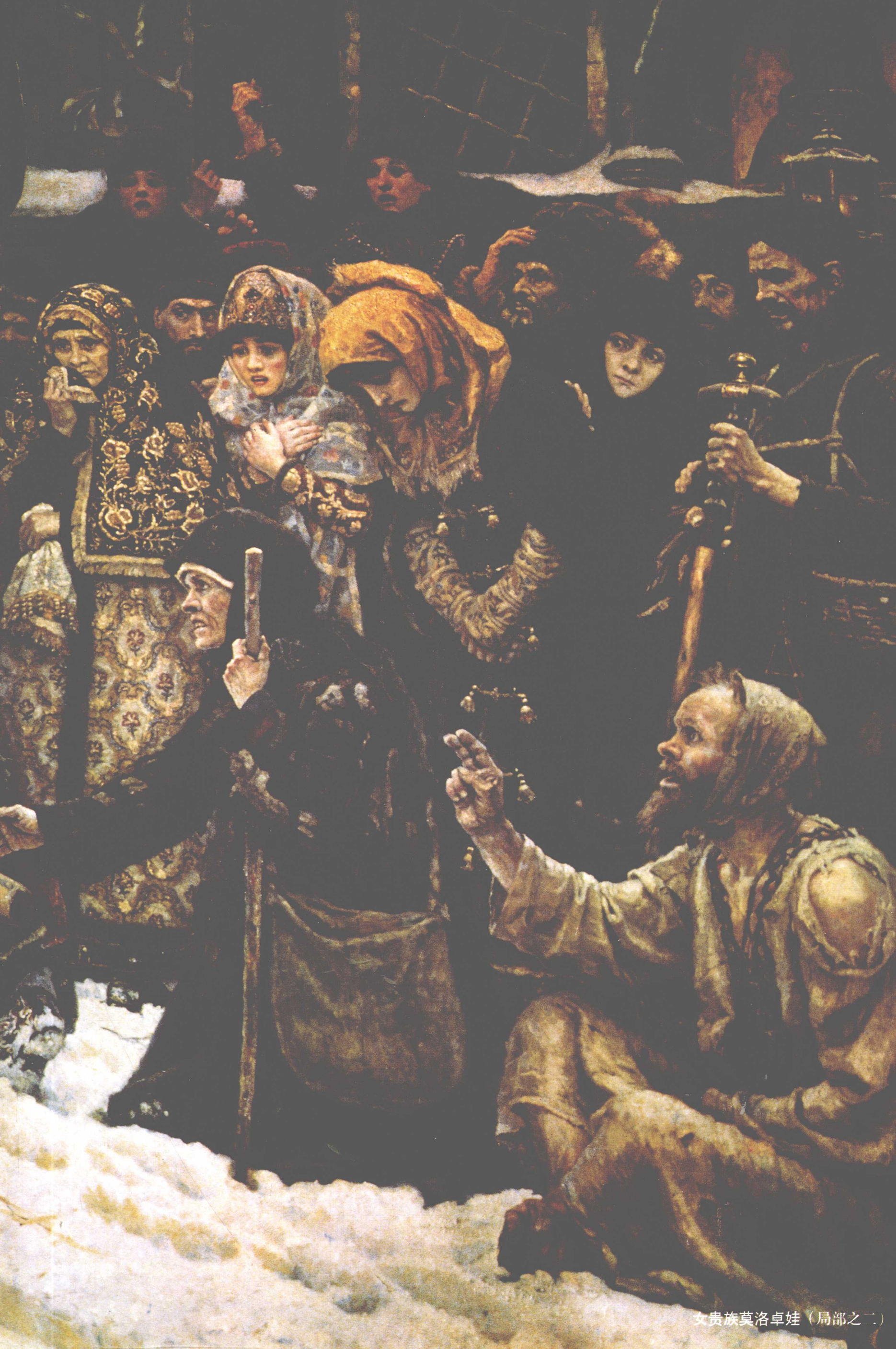
女贵族莫洛卓娃（局部之二）