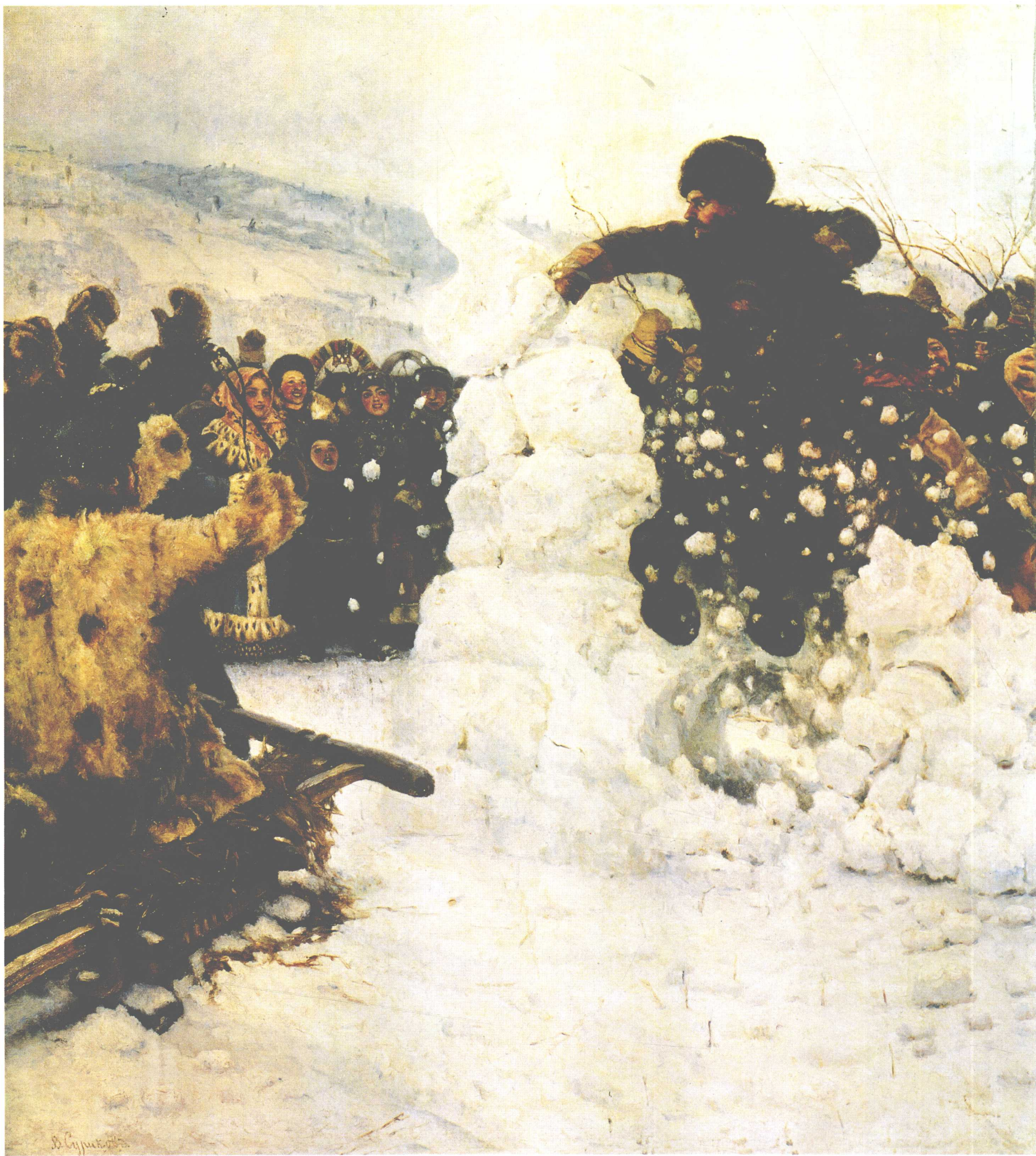
攻陷雪城 1891年 156cm × 282cm