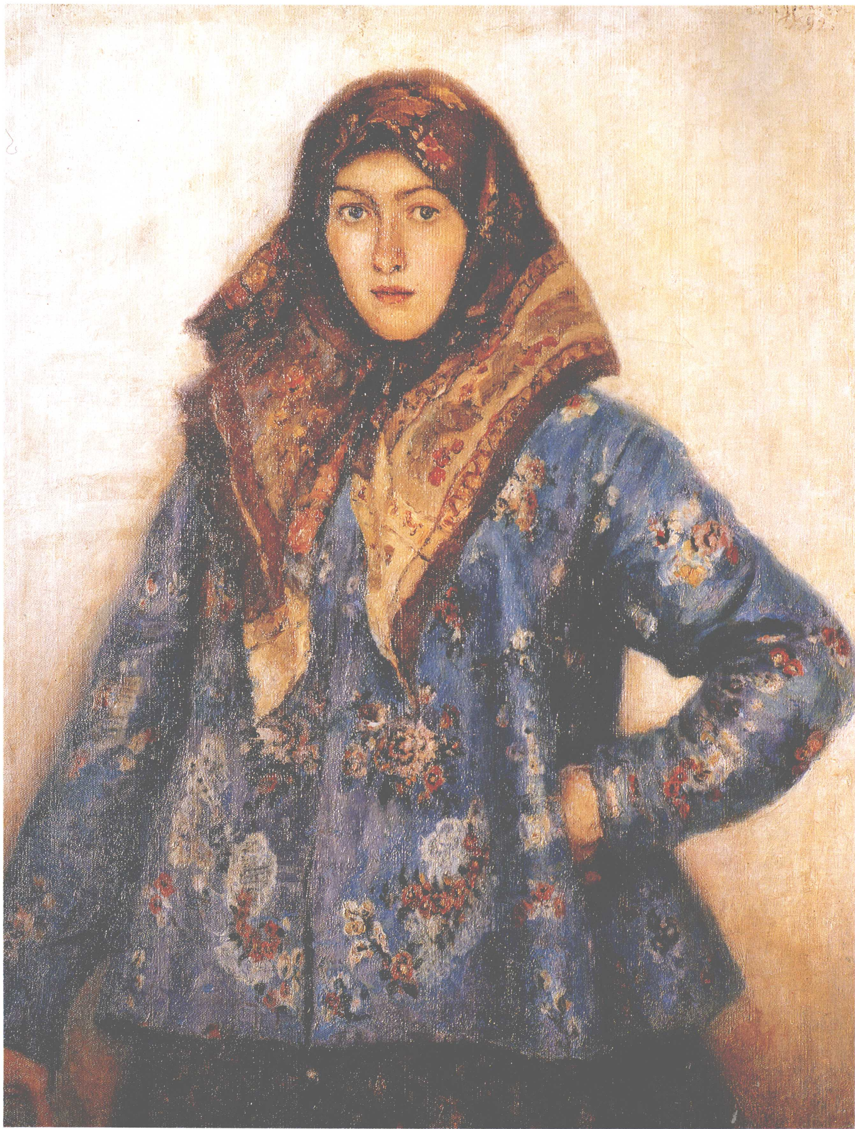
莫托莉娜肖像 1892年 86cm×68cm