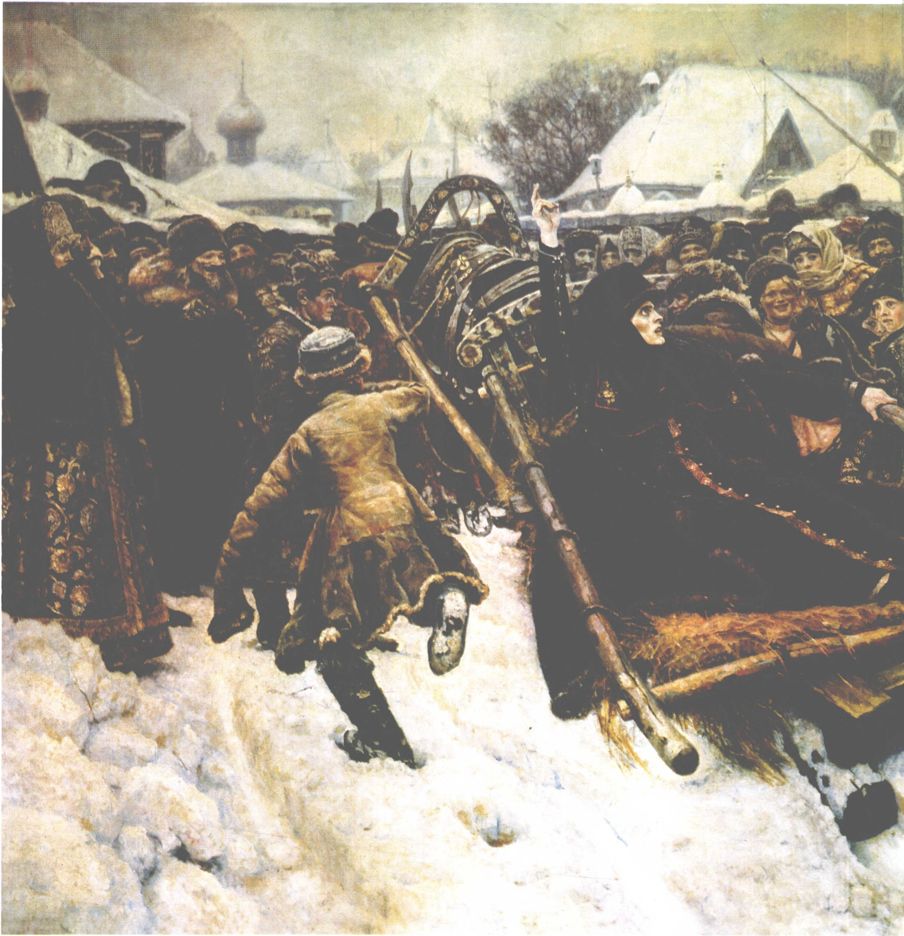
女贵族莫洛卓娃 1887年 304cm × 587.5cm