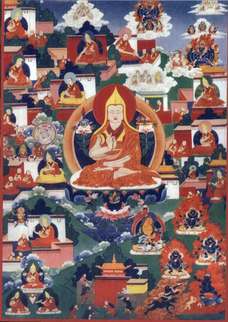
宗喀巴大师应化身