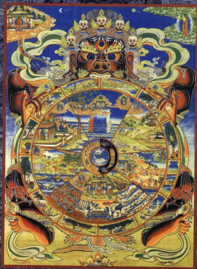
代表生死苦海的六道轮回图