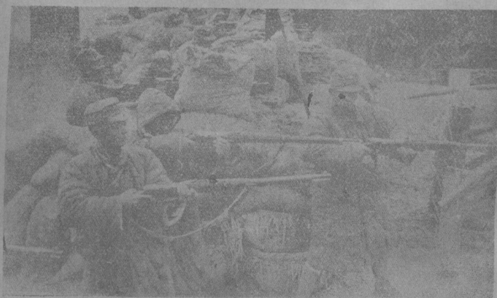
線防道一第軍我面方淞吳