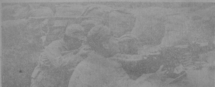
我軍之機關槍作戰