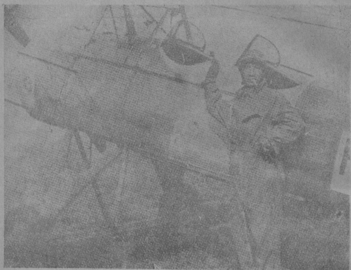
垣昭翁長旅之勇最戰作線前在