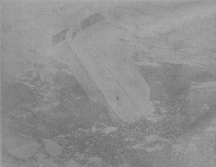
日飛機投下之大炸彈