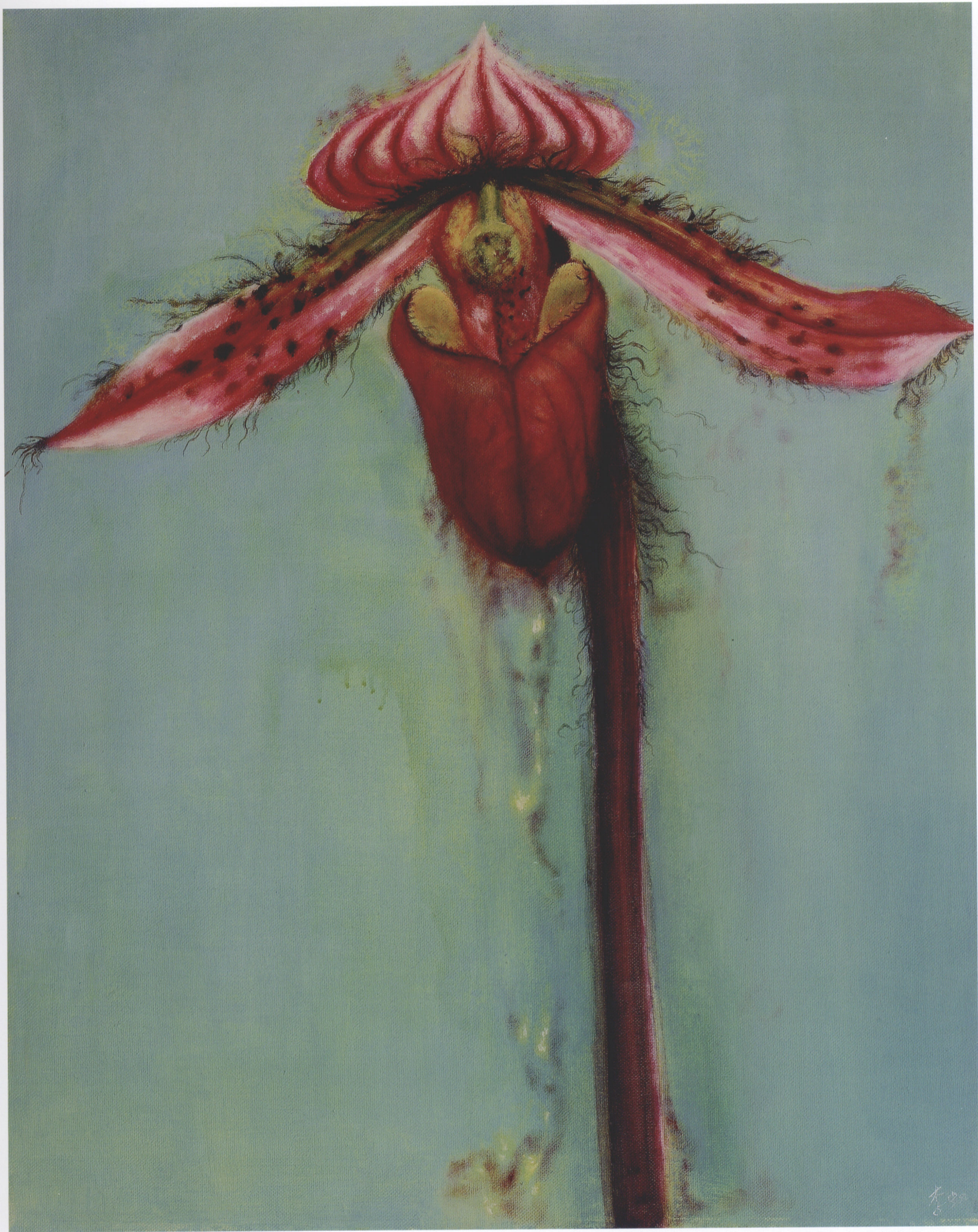
6. 《花色NO. 4》李虹 油画 50cm×40cm 2004年