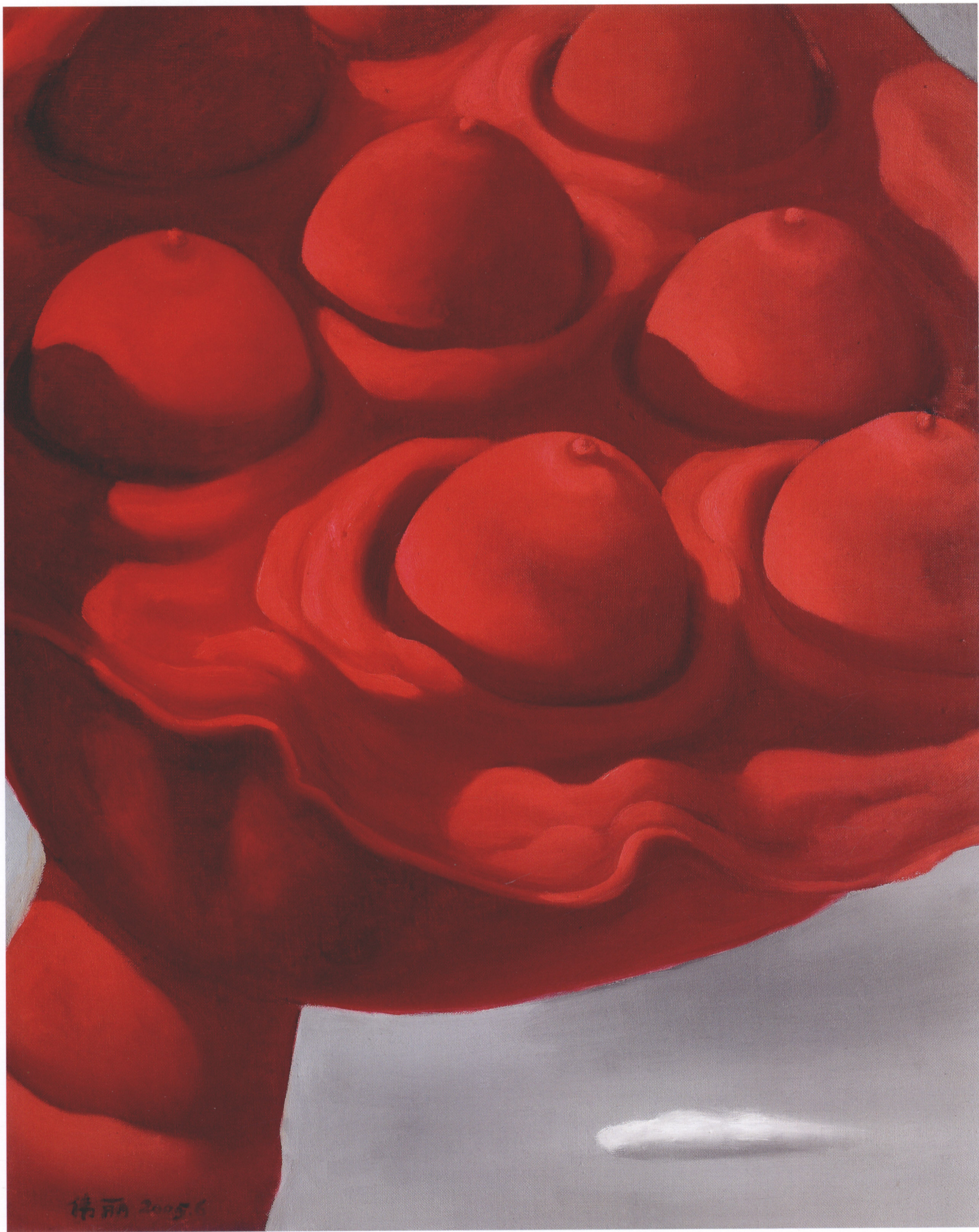
5. 《莲》 栾伟丽 油画 180cm×64cm 2005年