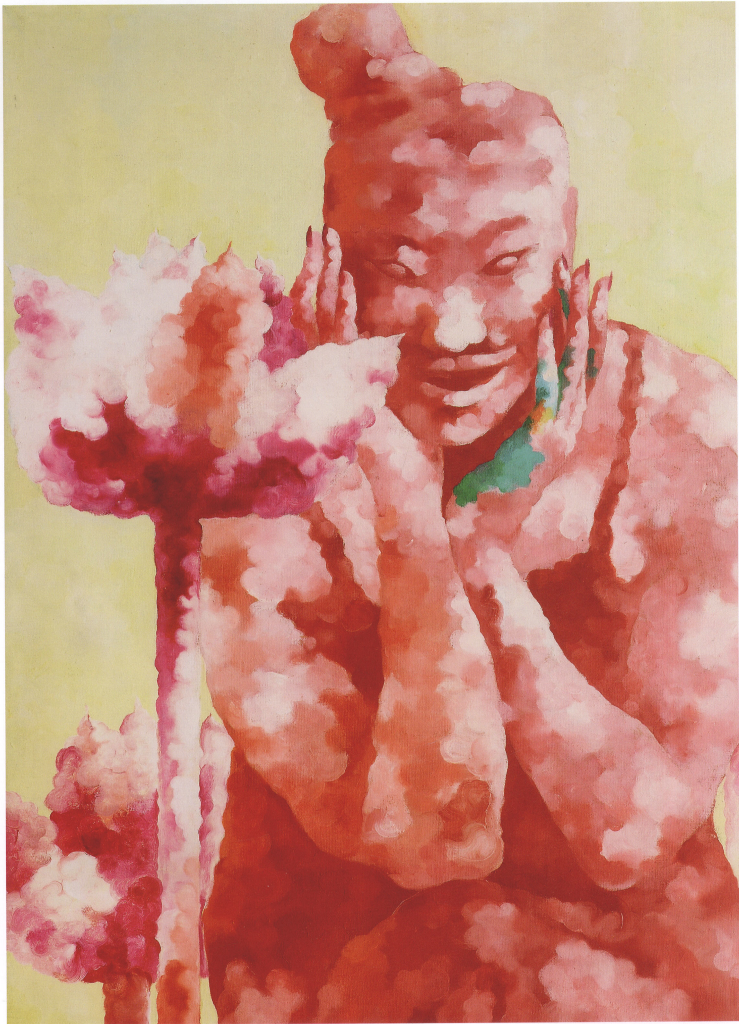
3. 《特级英雄杨根思》于保勋 油画 73cm×60cm 1999年