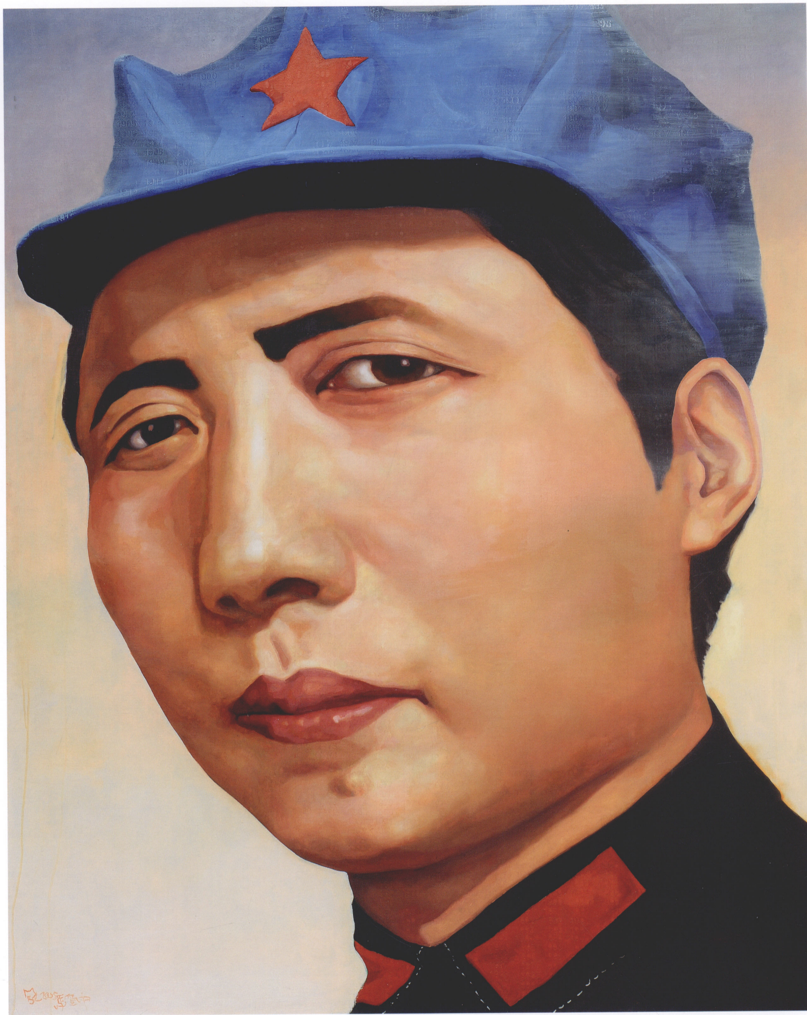
7. 《毛泽东》马保中 油画 200cm×160cm 2005年