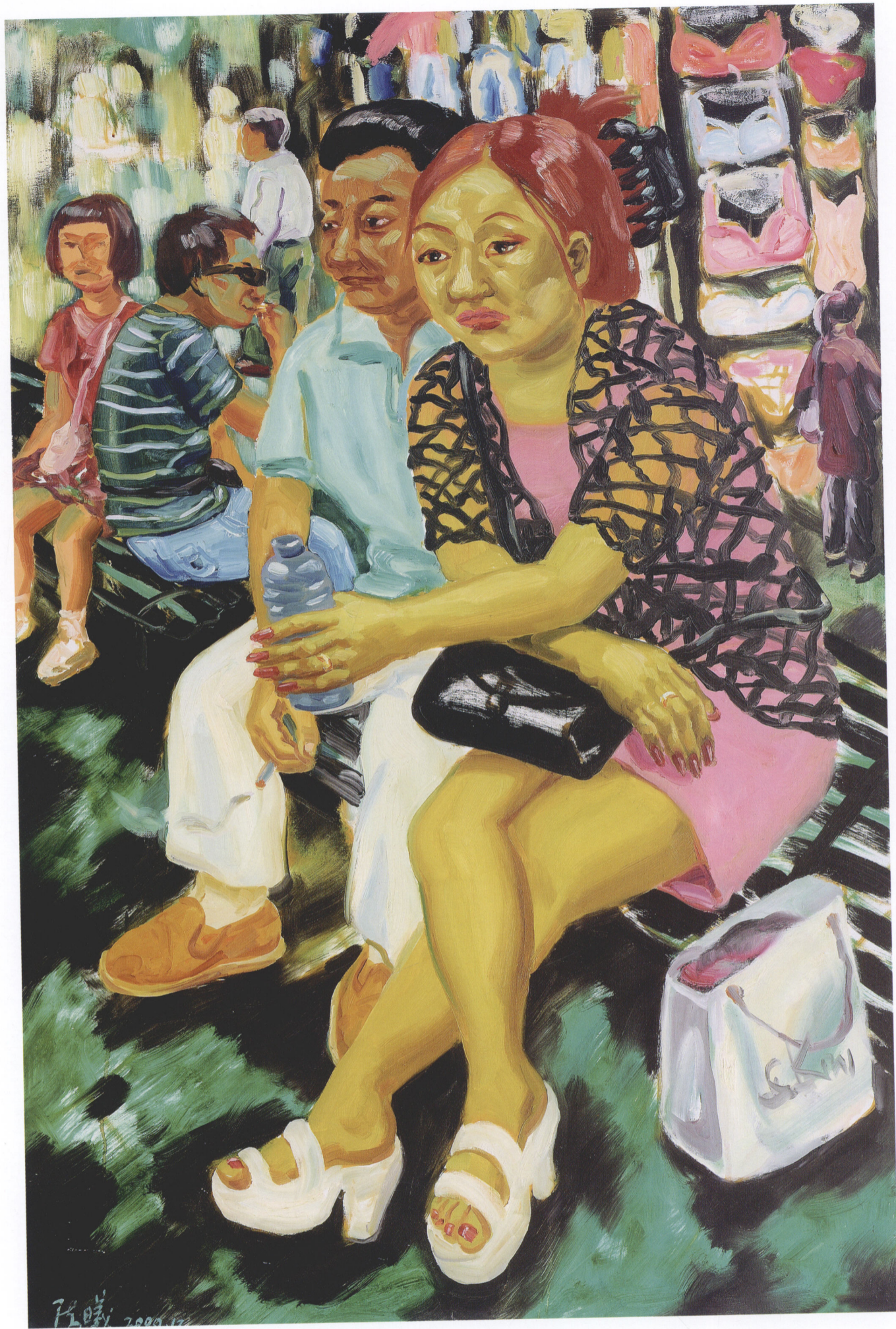
4. 《无名》陈曦 油画 120cm×80cm 2000年