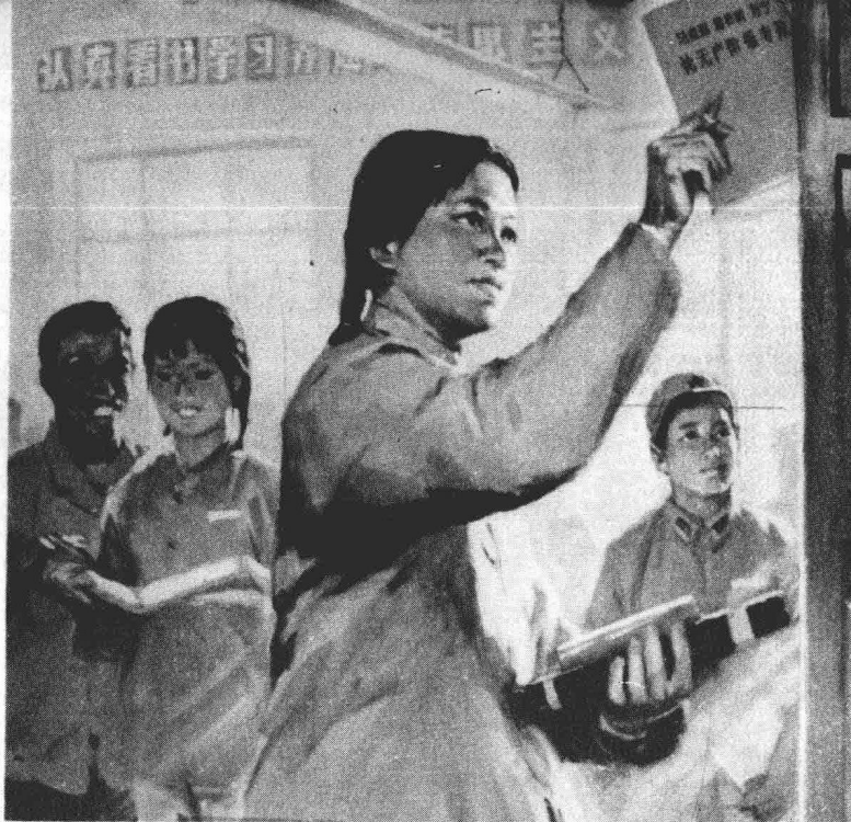
在斗争中学习无产阶级专政理论