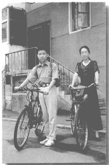
开 学 (1998年)