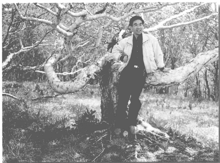
作者在中国长白山桦树林