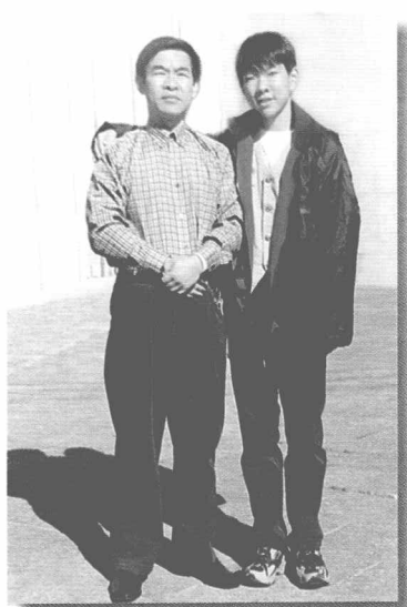
父 子 (2000年)