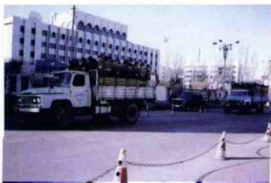
民兵奉命赴伊宁市执勤