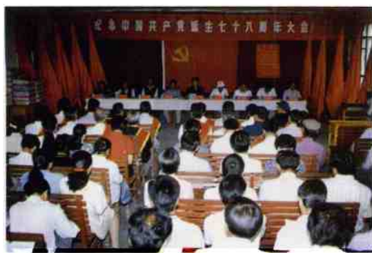
庆祝纪念党的生日大会