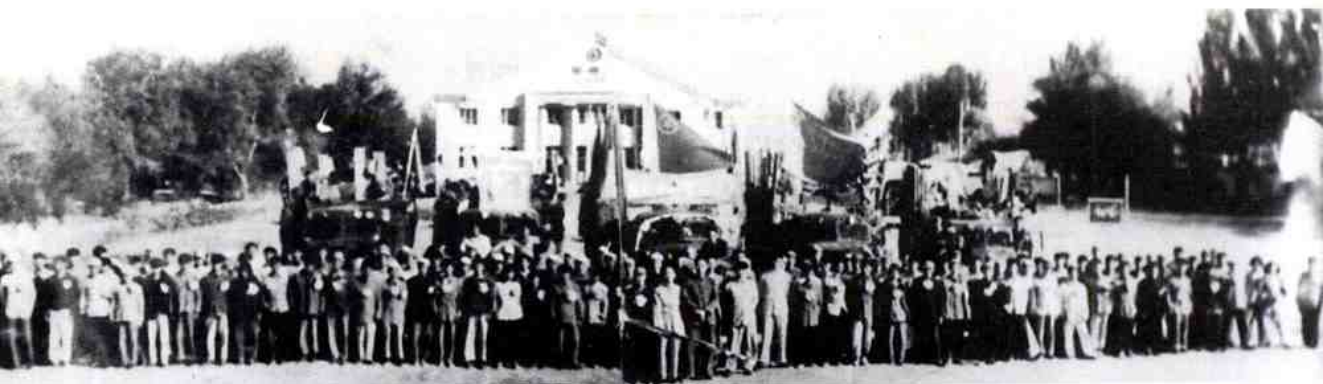
1958年,农四师领导在师部欢送全体青垦队员赴共青团农场。