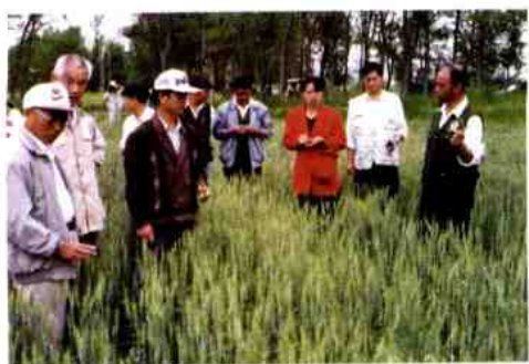
全团农业生产大检查