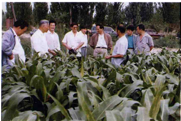
兵团副司令员胡兆璋(右四)来团检查工作