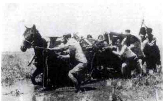
向共青团农场进发