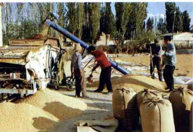
把最好的粮食上交国家