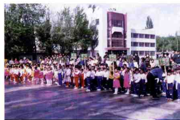
幼儿运动会入场式