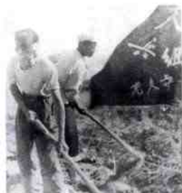
建场初期垦荒尖兵组