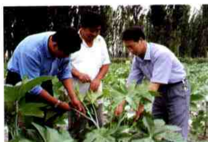
凌政委查看作物长势