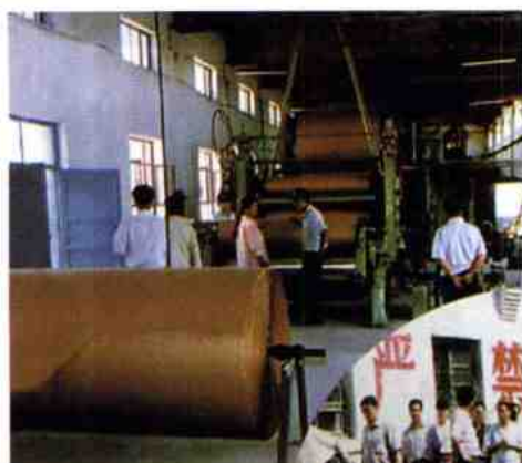
造纸厂 1600 生产线