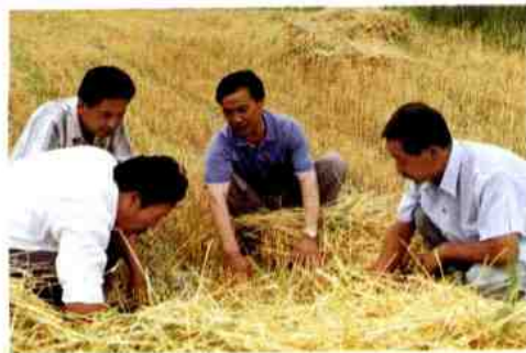
齐团长检查小麦收割质量