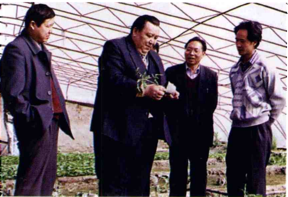
师巴副政委(维、左二)检查职工庭院经济发展情况