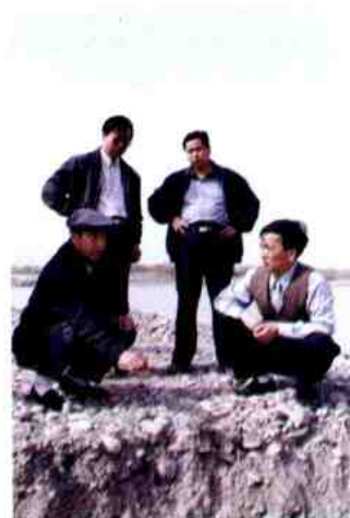
团领导在抗洪中现场指挥