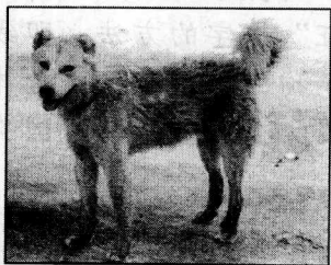
典型的中国狗，尾巴在身后卷起。

犬，中国人也将其称作狗；哺乳纲，犬科；听觉、嗅觉灵敏，犬齿锐利，前肢五趾，后肢四趾，有钩爪；性机警聪明，易受训练，按用途可分为猎犬、牧羊犬、警犬、玩赏犬、导盲犬、缉毒犬等。什么都敢吃的中国人最近又为其设立了一类，即食肉犬。每当看到街道两旁林立的“香肉馆”、“花江狗肉”之类招牌时，总感到一种莫名的悲哀。如果说，改革前的中国人为果腹活命，不得不吃掉“人类的狗伙伴”，尚情有可原，而今日已是“过剩经济”时代，那些脑满肠肥的人，仍在四处寻找“狗肉馆”大快朵颐，真不知是修养欠缺，还是天性卑劣。