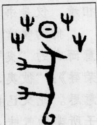
青铜铭文：莽中多了表示目标的“日”。

狗的祖先，即野狗，本是一种食腐动物，嗅觉灵敏是其特长，真要它们在树木草丛中捕杀猎物，肯定不会猎获什么，顶多是把动物驱逐出来。狗为人驱兽，并不知草丛之中趴伏有猛兽。人之聪明便在于己所不愿可驱狗为之，把草丛中潜伏的危险，让狗为之承担。因此，“莽”字有直率、冒