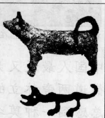
最早的图形文字“犬”与古代陶犬何等相似

观察上述字形，你会发现“犬”字必须横过来看，才能对应它的实际状态。这是为了适应汉字横窄竖长的特点，也是为了用刀在龟甲上刻写方便而作出的一种适应。3300年以前的上古先民，把“犬”字勾画成了竖立状，也恰恰是由于以上原因。“犬”字