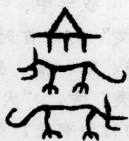
青铜器上的图形文字，描摹狗交配时的背对状态，上边则是一个表示交配的符号。

大概因为狗见到主人爱摇尾乞怜，导致人们对它的评价不高。古往今来，以狗喻人多有卑贱、轻蔑之意，走狗、狗屁、狗屎、狗官、狗眼看人低、狗掀门帘等等，都是带有贬义的习惯用语。