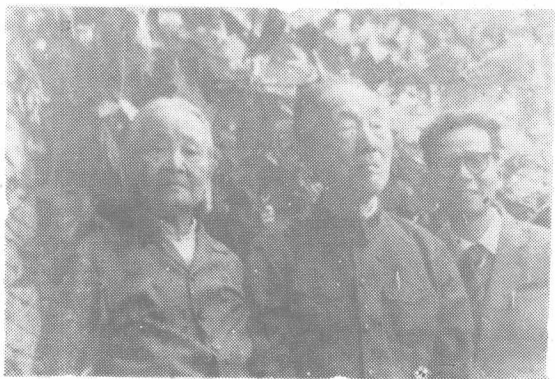
1985年秋，作者与著名心理学家潘菽教授及夫人在北京潘老家小花园留影。