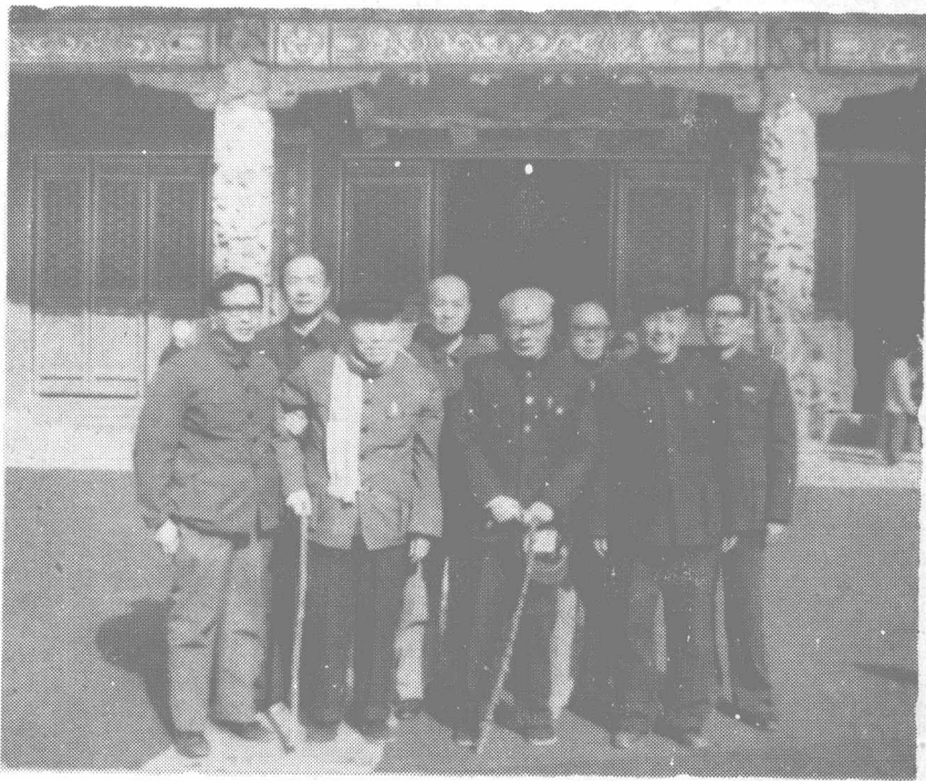
“中国心理学史”编写组成员与顾问潘菽学部委员、主编高觉敷教授1984年冬在曲阜合影。