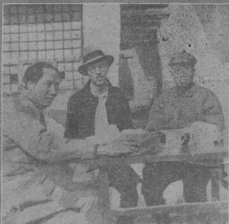
朱德·毛澤東與外國記者里夫談話