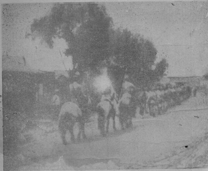
隊重輜其及軍路八第之中進推關型平向在正