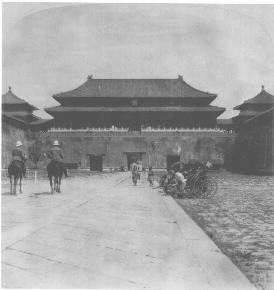
圖1 “庚子事變”後由英軍巡視的紫禁城

這張是1901年拍攝的照片，距離義和團事件後慈禧太后（葉赫那拉氏，1835-1908）等人逃離京城不久，紫禁城由英國軍隊站崗守衛。此時內有革命黨密謀起義，外有強權虎視眈眈，清政府的處境可謂“風聲鶴唳”。慈禧力求振作，向西方展示大國氣派，安排御前女官裕德齡（1886-1944）等擔任翻譯，與各國使節夫人往來。清室允許外人進出宮禁，情非得已，祇不過是八國聯軍侵華後的外交權宜之計。慈禧等人處處忍讓，複雜的心情可想而知。直到1902年，太平洋彼岸對中國示好、後來提出退還庚子賠款的美國，寄來一帖聖路易斯萬國博覽會邀請函，揭開了中國正式參加萬博會的序幕。