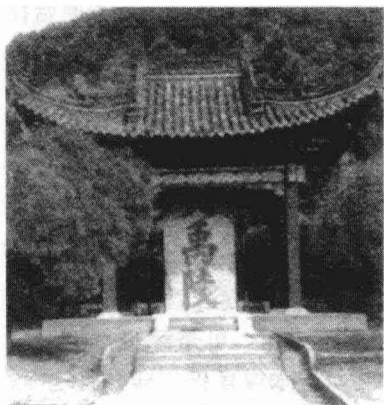
大禹陵，在今浙江会稽。

一个中年大汉对禹说道：“你父亲用石头和泥土垒成堤坝堵截洪水，刚开始还是有效的，后来洪水猛涨，堤坝就被冲垮了。”