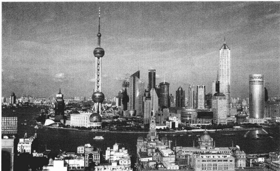
上海黄浦江和江对岸的浦东

1992年下半年，在新区筹备期的一次会议上，赵启正第一次提出了要注重“功能开发”，强调形态规划必须服从功能规划，以功能目标带动形态规划和建设。现在，“功能开发”已经作为一种开发区的理念被广泛运用，他也因浦东开发的丰富经验被南开大学聘为兼职教授，7年中培养了8个区域经济学的博士生。