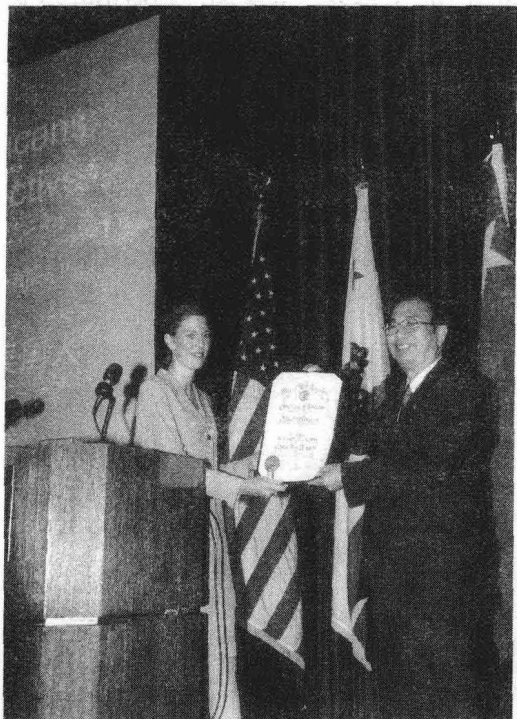
2000年9月，赵启正在美国旧金山演讲

1999年，“法国中国文化周”中，赵启正提出了“中国是一只喜狮”的新描述；2000年，“中国文化美国行”活动期间，他在华盛顿新闻记者俱乐部的《中国人眼中的美国和美国人》演讲的结尾，以美国式的幽默说，“中国人民希望美国是一个真正的美丽国家，而不是一个美丽的帝国主义”，得到了热烈掌声；2003年，在“俄罗斯中国周”，发表了题为《以文化为纽带开创中俄友好的新世纪》的演讲，并回答了听众20多个好奇的、友好的、尖锐的提问，赵启正的演讲和答问多次被热烈的掌