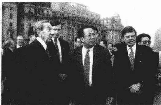
1996年11月21日，赵启正陪同美国国务卿克里斯托夫、美国大使尚慕杰在黄浦江西岸遥望浦东

不只是土地开发、项目开发，而是社会开放，即争取社会的全面进步”。他对浦东开发者说要完成这个任务、实现这个目标，“要在地球仪旁边思考浦东开发”，“要先用心，再用力”，一靠严谨的科学态度，大胆地发挥创造性，二靠勤奋的学习，三靠兢兢业业的工作。