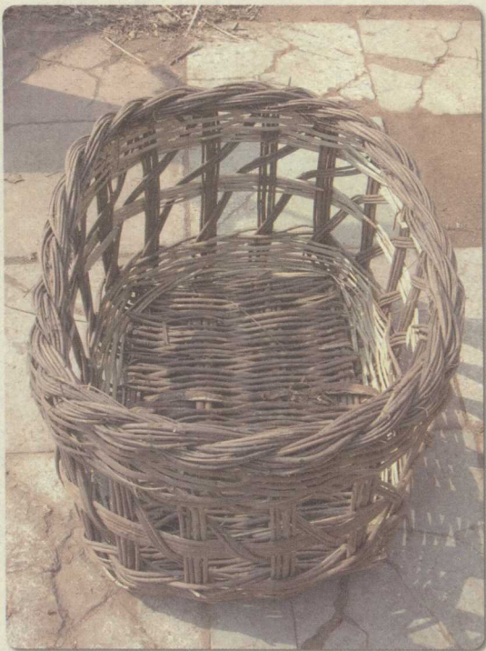
北京房山藤编菜筐

手工艺品，也称为“民间手工艺品”，是劳动人民为适应生活需要和审美要求，就地取材，手工生产的工艺品。手工艺品的种类繁多，因各地区、各民族的地理环境、社会经济、历史文化、风俗习尚、审美趣味的不同，各地的手工艺品形成了具有地域特色的风格特征，展示了中国手工艺艺术的风貌。