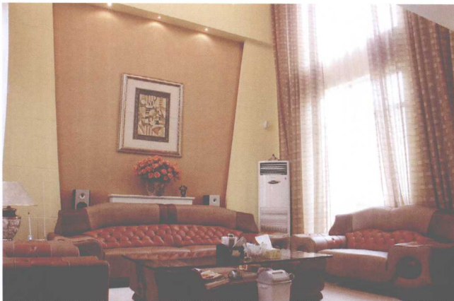
高挑的空间和巨大的窗户让空间气度非凡