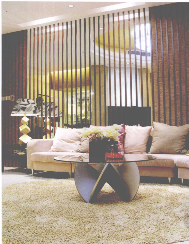
镜子营造出亦真亦幻的美妙空间