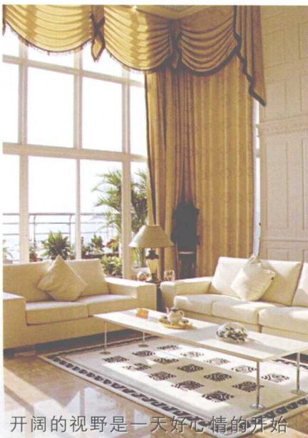
开阔的视野是一天好心情的开始