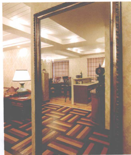
镜子不仅仅是起到装饰的作用