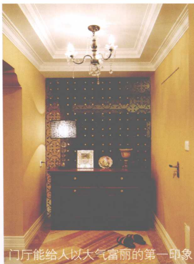
门厅能给人以大气富丽的第一印象