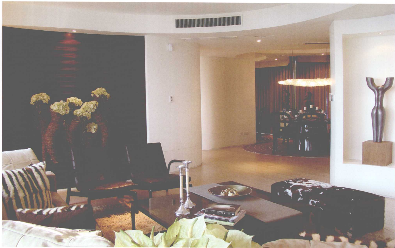
柔和的线条丰富了空间造型，富有灵气