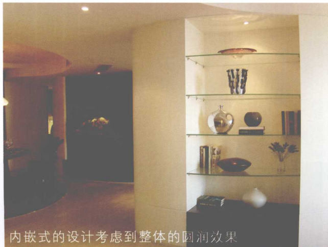
内嵌式的设计考虑到整体的圆润效果