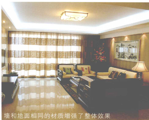
墙和地面相同的材质增强了整体效果