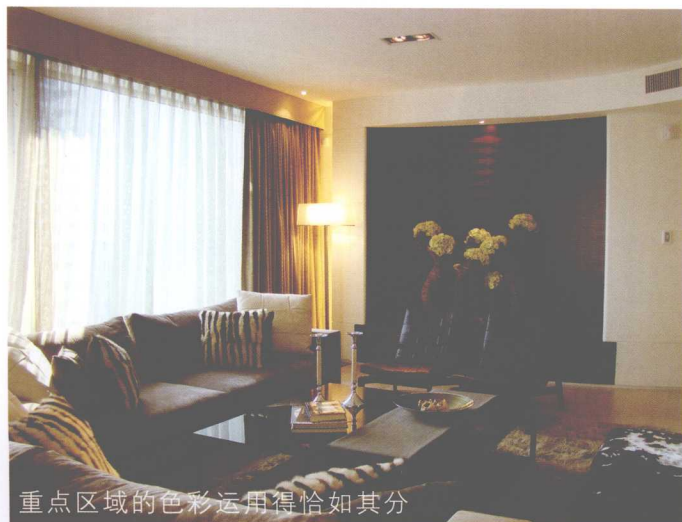
重点区域的色彩运用得恰如其分