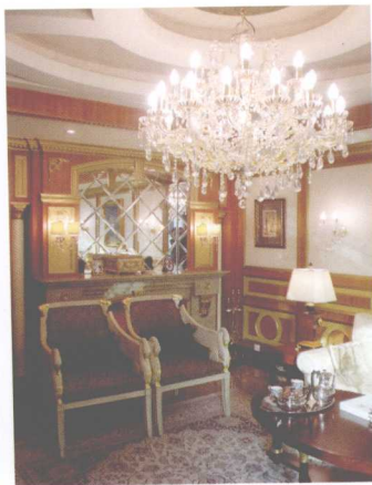
色彩及图案的变化带来协调的氛围