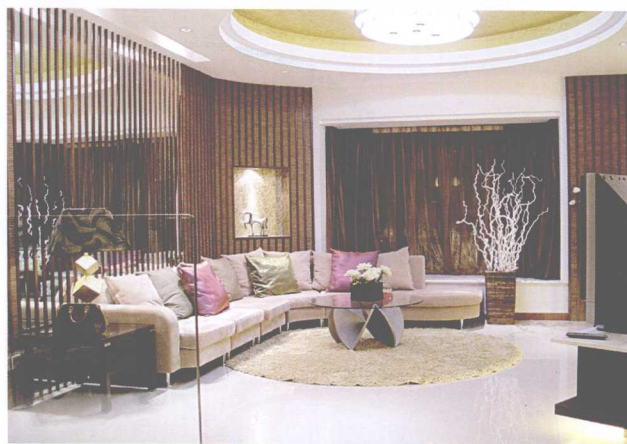
镜子巧妙地使空间有戏剧化的效果