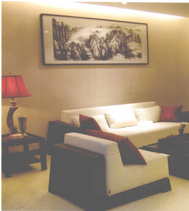
造型别致的沙发不落俗套，有新意