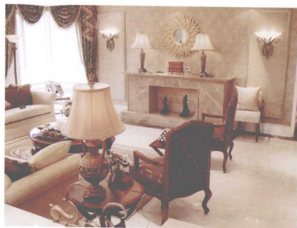
欧式风格对空间的大小有一定的要求