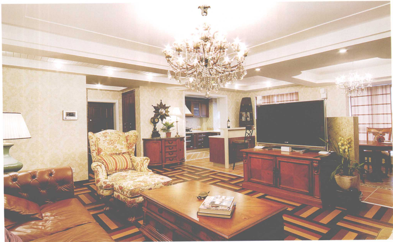
多种材料的巧妙运用达到了很好的装饰效果