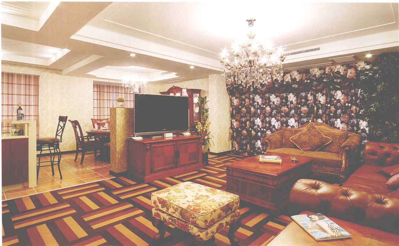
天花板的造型划分了区域功能