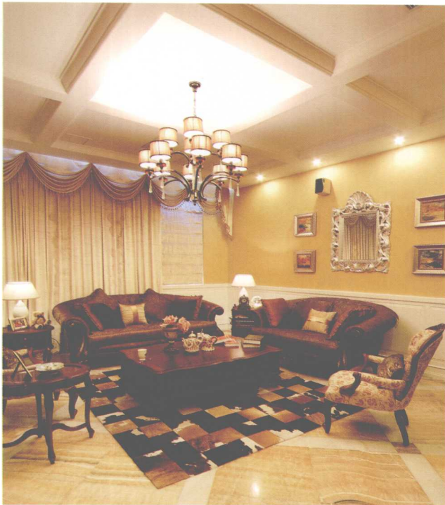
相对独立的会客区，地毯勾勒出了相应的区域