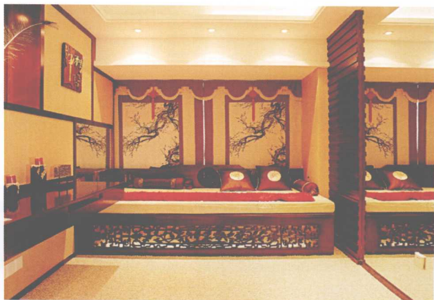
宫灯、家具、字画不仅仅是符号