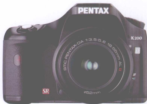
宾得K200D 有效像素：1 020万 传感器尺寸：23.5mm×15.7mm

影像传感器（CCD、CMOS）的尺寸是要重点介绍的重要参考标准。受限于数码单反相机的大小，不同的机型影像传感器的大小也不同。在胶片相机中，135画幅相机的35mm是最为常用的胶片尺寸，这也成为数码单反相机的影像传感器的比较基准。DSLR中的传感器尺寸一般要比35mm胶片小。影像传感器的成本极高，通常来讲，传感器大的相机价格也相对要高一些，比如佳能 EOS-1DS Mark III，配置了和135相机胶卷同样大小的影像传感器。根据影像传感器的大小不同，配合适当数量的像素将会得到最好的影像质量。因此，在选购单反相机时不要只以像素多少来作为选择的标准，应该把像素的多少和传感器的尺寸一起作为选择的重要标准。在考虑到自身预算、摄影目的后，挑选最合适自己的DSLR。