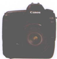
准专业级数码单反相机 佳能 EOS 5D II