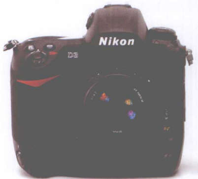
专业级数码单反相机 尼康D3