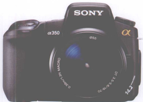
索尼α 350 有效像素：1 420万 传感器尺寸：23.5mm×15.7mm

一般对于初学者来说，选择一台入门级的数码单反相机已经足够用了。况且随着技术的进步，入门级的相机已经日益完善，比如佳能500D、尼康D5000、宾得K200D等，都足以满足摄影者在不同场合的摄影要求。无论是从感光元件的使用还是快门速度、连拍速度和测光等方面，各大厂商虽然各有卖点，但是随着新款相机的不断涌现，相差不会太大。