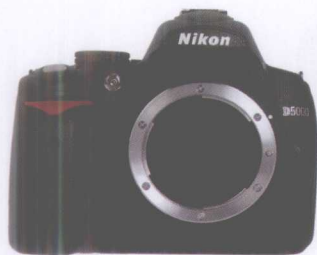
入门级数码单反相机尼康D5000

目前市场上的数码单反，以入门级的型号最为丰富。几乎各大品牌都有自己的入门级相机。这类产品的外观时尚精致，摄影中所用到的功能几乎都具备，像素也不亚于专业相机。其缺乏的就是良好的操控手感、扎实的用料做工及高速连拍和最快的快门速度等功能。其市场价格一般在5000元左右，适合摄影初学者和要求不高的摄影爱好者。