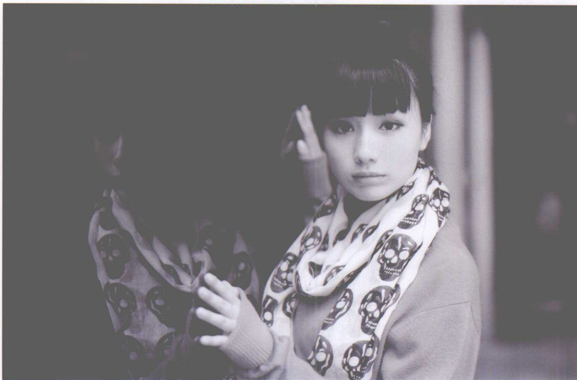
美女人像照，画面简洁，突出时尚感

人像摄影的艺术性主要表现在艺术的意蕴。艺术的意蕴就是指深藏在作品中、内在的含义或者意味，具有多义性和模糊性，体现为一种哲理或神韵，需要欣赏者反复领会、用心感受，这是艺术摄影的不朽魅力。人像艺术摄影并不是件容易的事，也许就在我们周围有很多人为了得到更高的艺术分数而竭尽全力付出，但事实上，艺术摄影并不在于能否取得高的分数。艺术并不属于竞争范畴，它更多的是精神层面的，它可以壮大自己，满足自我的心理诉求。但环境早已让我们习惯了各种竞争体系，因此艺术摄影并不是件容易实现的事情。但是随着时间的推移，我们会不断地充实自己内心的艺术框架，从而提高自我标准，提高自我实现的个体艺术。当个体艺术标准得到升华时，我们所拍摄的照片才有越过个体艺术与大众艺术的分界线的可能，只有跨过了这条线，才算在自己和他人公认摄影艺术道路上迈出了艰难的一步。