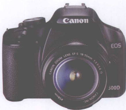
入门级数码单反相机佳能500D