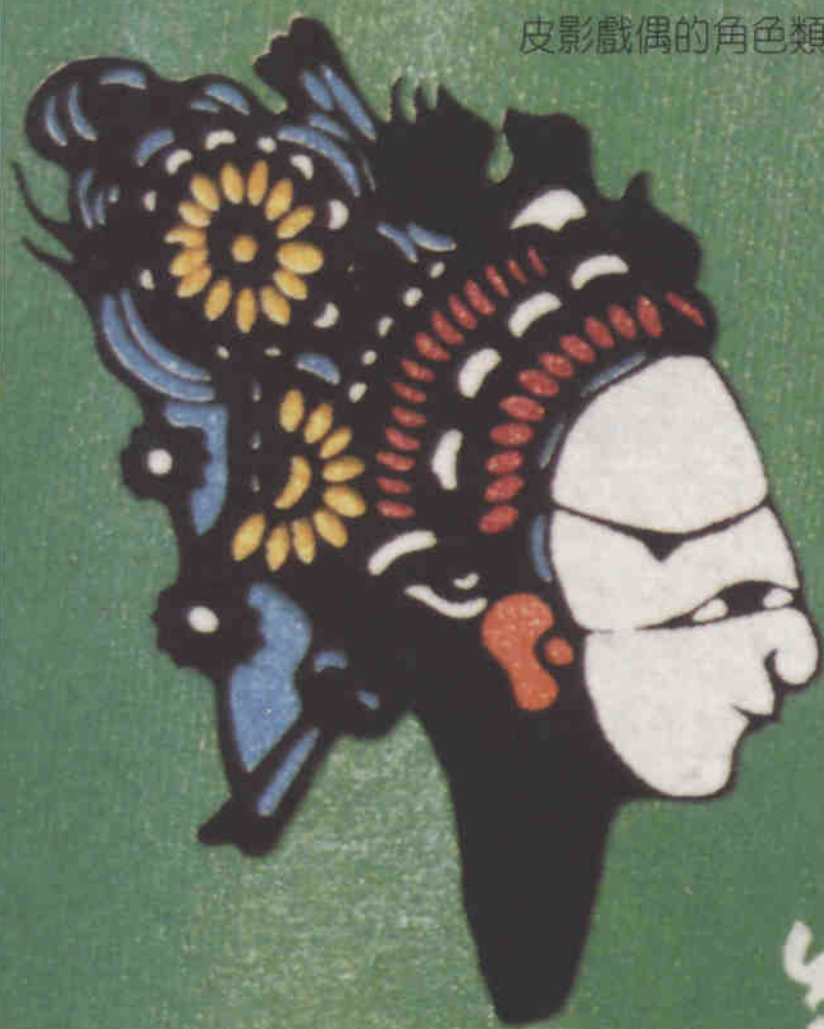
皮影戲偶的角色類別（皮影戲館製作）