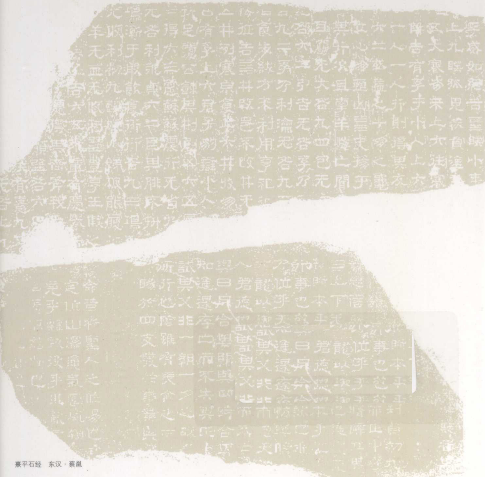
燕平石经 东汉·蔡邕