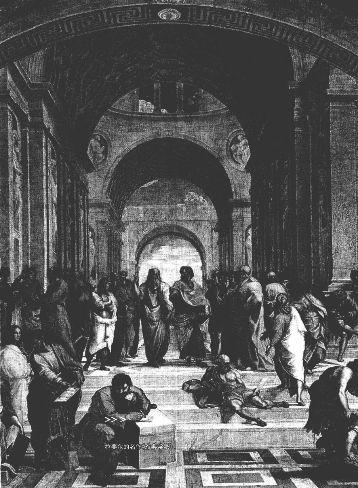
拉斐尔的名作《雅典学派》。