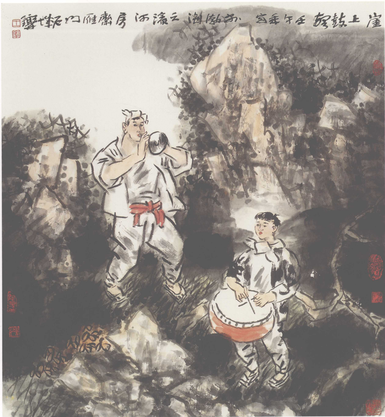
《崖上鼓声》(纸本) 2002年 95x95cm