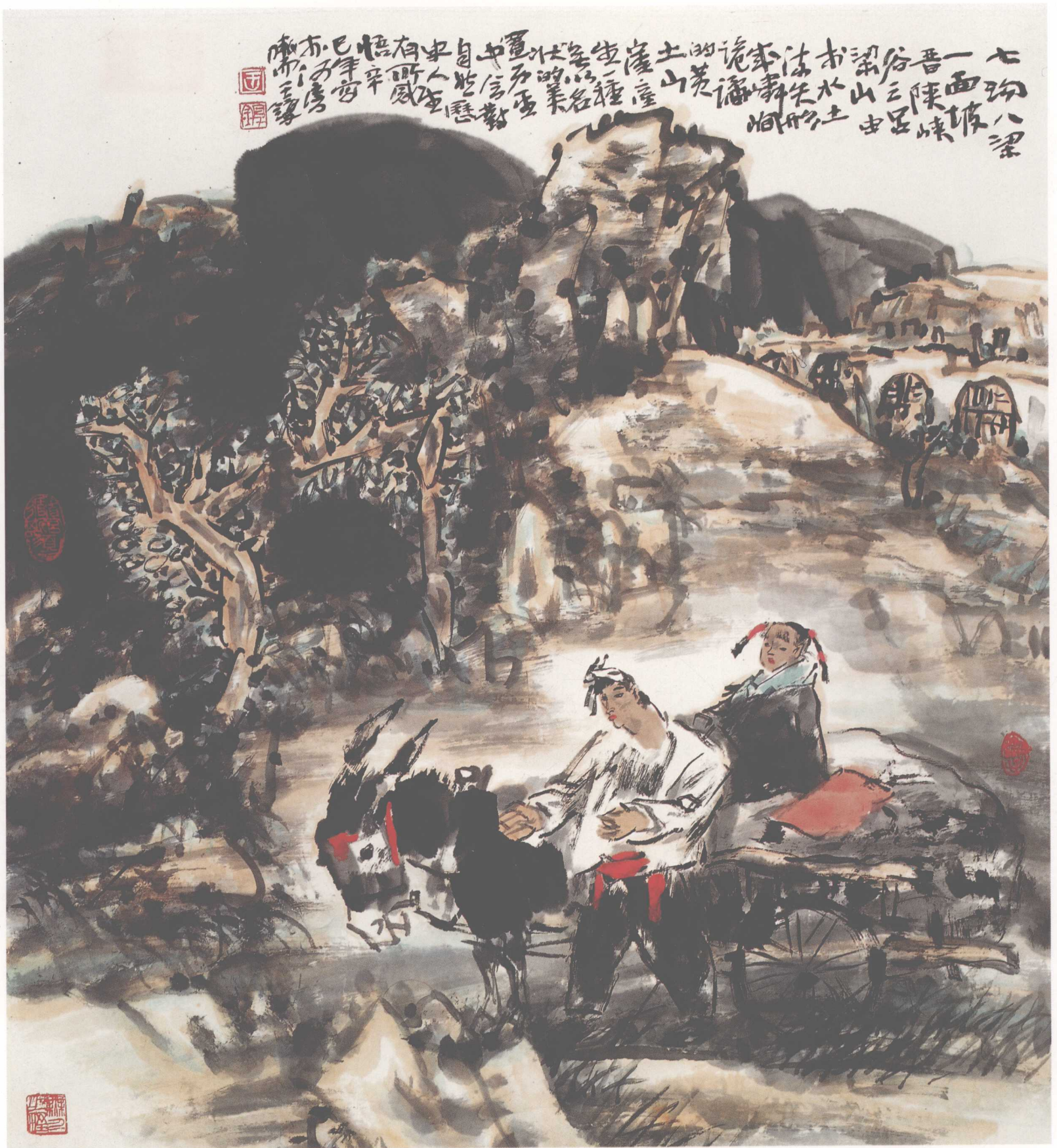
《七沟八梁》(纸本) 2000年 95x95cm