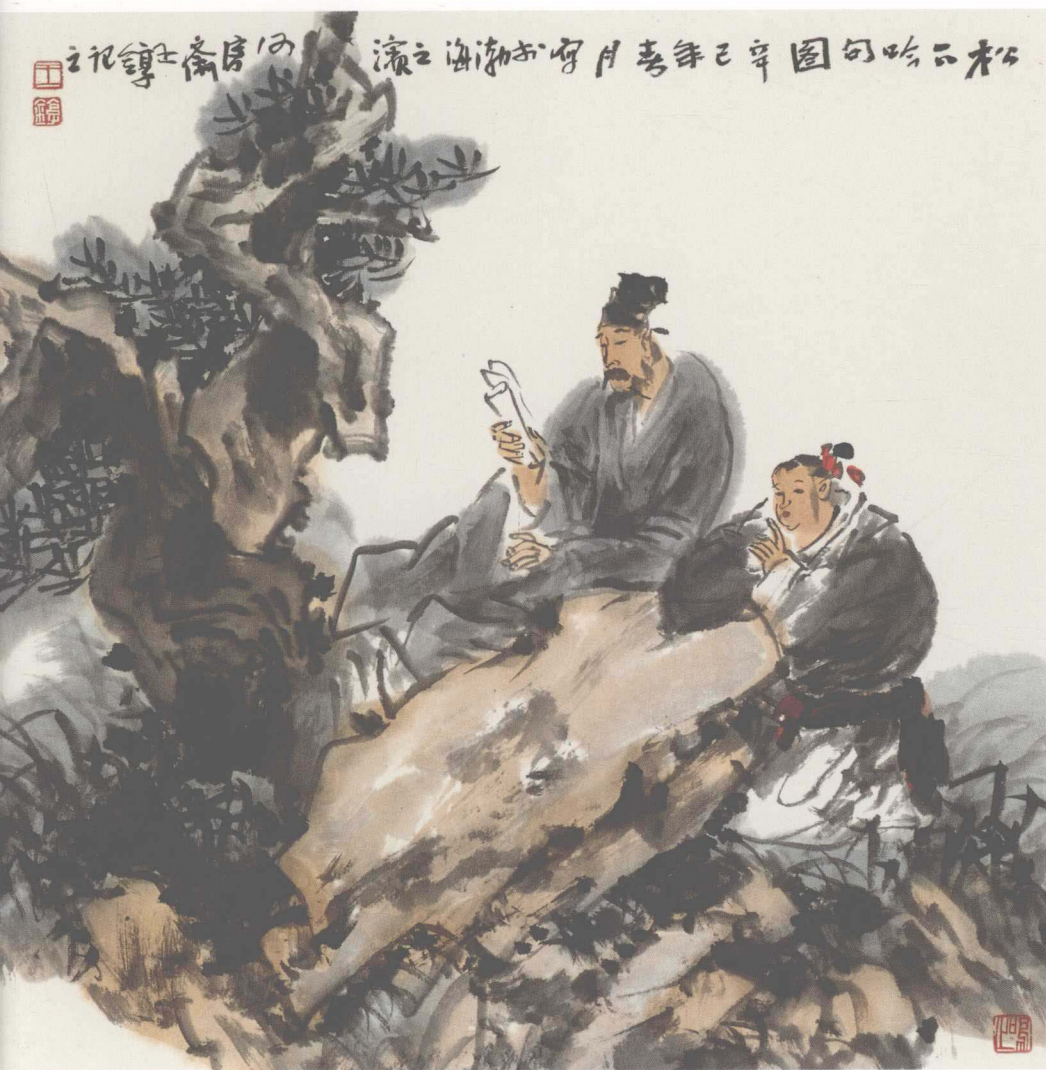
《哲人》(纸本) 2001年 68x68cm