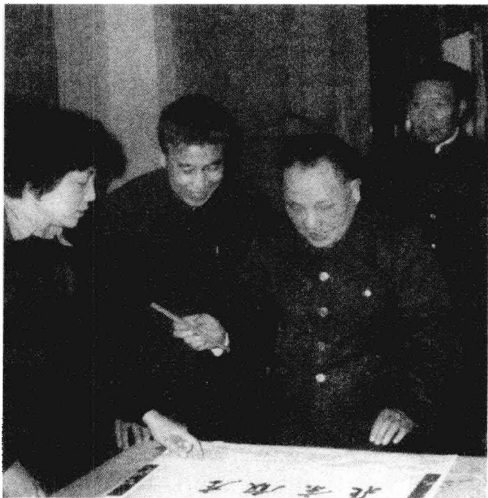
邓小平为北京饭店题写店名。

在座的各位老总先是一阵惊愕，哪有六星级饭店？按照中国旅游局的规定，饭店只有五星级，根本没有六星这个级别！但是他们毕竟头脑敏捷、不同凡响，很快就明白过来了，这是专家在测试他们的眼光，测试他们对未来的洞察力。